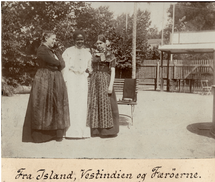
[6] “Úr Íslandi, Vestindisku oyggjunum, og Føroyum”. Úr úrklipsbókini hjá Dansk Kunstflidsforening, 1905. Danska tjóðsavnið.

fólkabúna. Búnarnir hava helst havt ymiskar mentanarligar týðningar á ymsu stöðunum: búnarnir, sum teir føroysku, grønlandsku og íslensku luttakararnir eru í, eru sera líkir tí, sum verður nevnt tjóðarbúna í dag. Hvíti klæðningurin og puntuta madras turriklæðið, sum karibiska kvinnan var í, verður harafturímóti ikki fatað sum ein tjóðarbúni, men sum bestu sunnudagsklæðini til eitt serligt høvi í Jomfrúoyggjunum í US (Nielsen 2016).