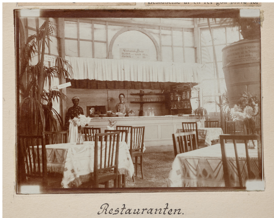
[9] “Matstovan”. Úr úrklipsbókini hjá Dansk Kunstflidsforening, 1905. Danska tjóðsavnið.

I stóru rotunduni, har panoramamálaríið frá St. Thomas myndar bakgrundina, sita grønlandsku og føroysku kvinnurnar í hugnaligum práti við einum kaffikoppi. Vit heilsa upp á tær ungu damurnar úr Grønlandi, sum sveitta í