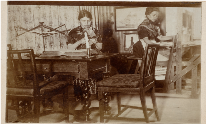
Glasstuen med færøiske Piger.