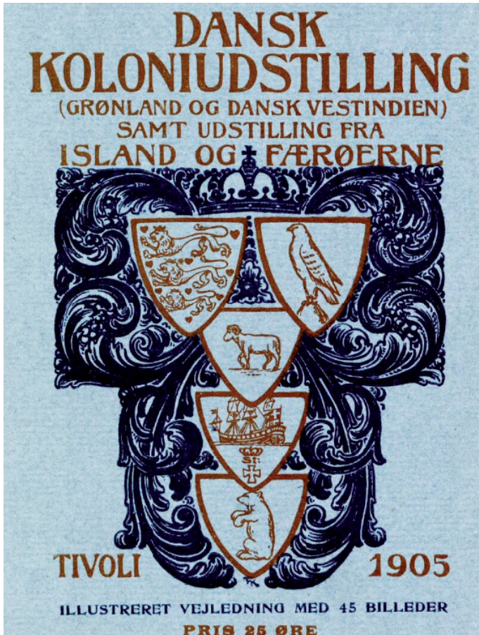
[II] Myndprýdd vegleiðing við 45 myndum úr Tivoli Framsýningini í 1905 eftir Andreas Bruun.

soleiðis sum londini vóru víst fram. Sum Thisted og Gremaud (2020, 40) vísa á, endurspeglast hetta eisini í myndunum á forsíðuni av framsýningarkataloginum, har symbolini fyri Danmark og Ísland verða víst lið um lið, meðan symbolini fyri Føroyar, Vestindia og Grønland eru minni og sett undir hvørjum øðrum, rammað innan fyri framhaldi av tí kongabláu krúnuni. Ógreiða føroyska støðan í framsýningini undirstrikar ta tvítyddu, føroysku støðuna í danska heimsveldinum undir hesi tíðini, sum á ein hátt er ósambærilig við íslenska “sivilisatíons”-støði, men samstundis vegna rasuhugsan øðrvísi enn afro-karibiska fólkið í Vestindia og inuit-fólkið í Grønlandi.