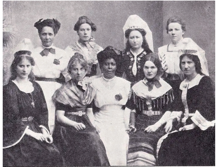
Sommerkursus i Dansk Kunstflidsforening. Unge Piger fra Island, Færoerne, Sonderjylland og Vestindien.

stuðla einum árligum summarskeiði fyrir kvinnur úr Íslandi, Føroyum, fyrrverandi dansk Vestindia og Suðurjútlandi. Hvørt sumar vóru umleið 10 kvinnur bodnar undirvísing í at veva, spinna við hond, knipla og at brodera frá 1. juni till 1. oktober (Dansk Kunstflidsforening 1906). Ein mynd, sum er tøk í dag á www.emmagad.dk og upprunaliga varð prentað í bókini Kvindernes Årbog frá 1912, avmyndar “Ungar gentur úr Íslandi, Føroyum, Suðurjútlandi og Vestindia” á einum summarskeiði [12]. 22 Myndin er helst tikin á árliku veitsluni á Charlottenborg, har kvinnurnar tiltrektu serligt uppmerksemi, sum sæst í eini grein í donsku avísini Dagbladet frá 21. september 1910: