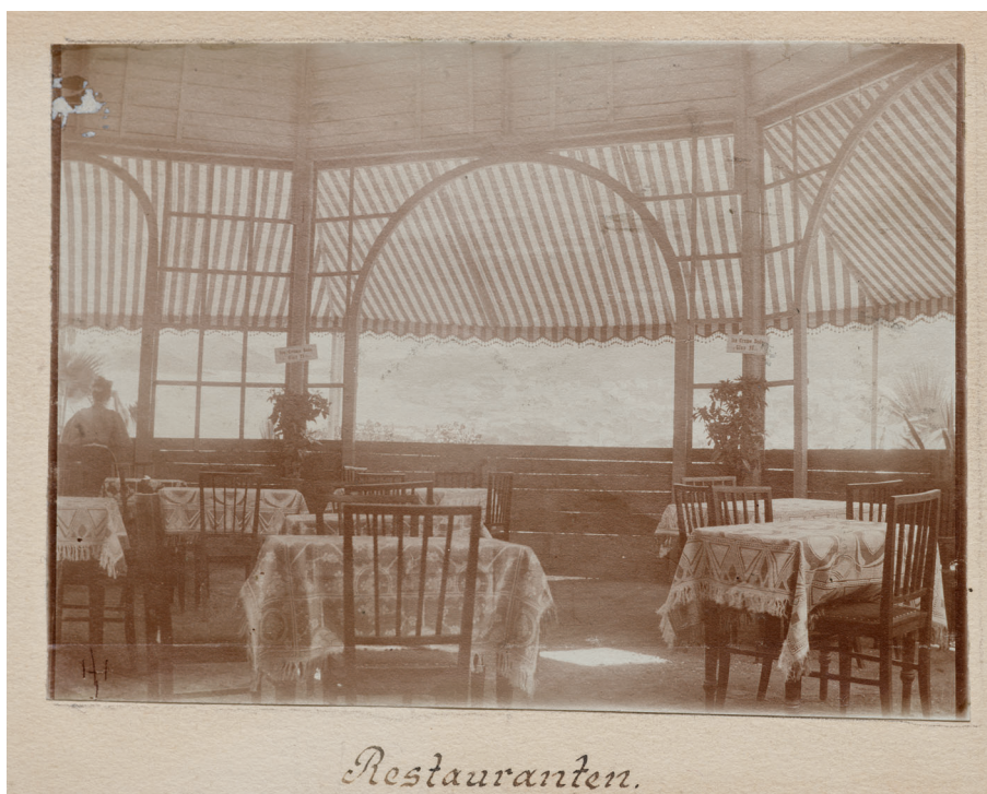
[10] “Matstovan”. Úr úrklipsbókini hjá Dansk Kunstflidsforening, 1905. Danska tjóðsavnið.

Hin svartu daman nærkast bólkinum. ‘Eg hevði so gjarna viljað hoyrt tær ungu genturnar tosa grønlendskt,’ sigur hon. Grønlendsku kvinnurnar steðga brádliga samrøðuni og hyggja undrandi at teirra svørtu landskvinnu. ‘Tit verða vónandi ikki bangnar, tí eg eri so svørt?’ spyr n**** spakiliga. ‘Á nei, vit eru jú eisini sjálvar eitt sindur myrkabrúnar,’ svara grønlendsku damurnar