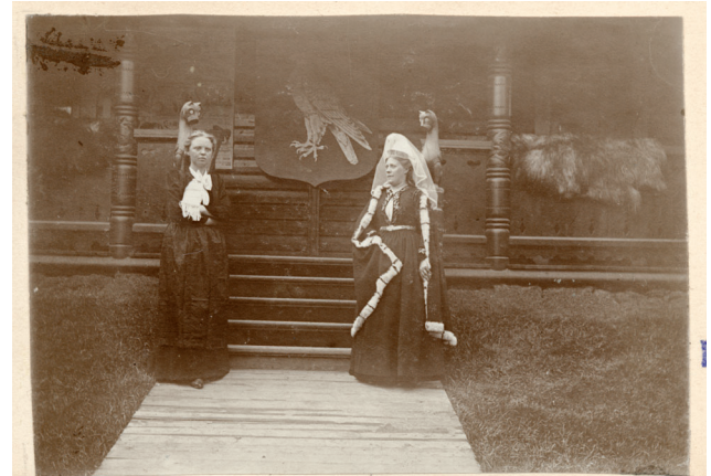
Ísländerinder udenfor det islandske Hus.

disku oyggjarnar. Cornelins (1976, 26-27) lýsir, hvussu luttakarar á framsýningini vitjaðu hvønn annan á ymsu deildunum á morgni, tá ið tað vóru fá vitjandi: