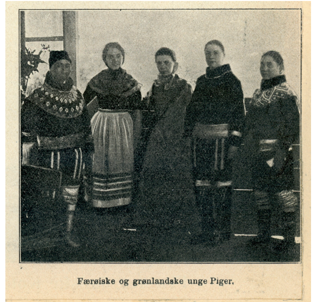
Færøiske og grønlandske unge Piger.

dokumentati3n aveinari spontanari l3tu, tey tykjast at vera n3tt3rlig og avslappað [7]. Spontaniteturin verður undirstrikaður við voyeurst3ðuni hj3 myndataka- ranum aftan fyri eina plantu. Í kontrast er myndin av teimum fimm kvinnunum, sum verður lýst sum “f3roysskar og gr3nlandskar ungar gentur.” Tær eru settar í eina skipað r3ð og venda m3ti myndat3linum á vestindisku matstovuni – myndin er uttan iva uppstillað [8]. Hendan myndin er prentað í einari danskari avis og savnað í b3kuni, og kornuta g3ðskan á myndini skapar eina frást3ðu til myndina og ger tað torført at s3ggja tær haptisku detaljurnar í sambandinum millum kvinnurnar, sum tykjast at leiðast.