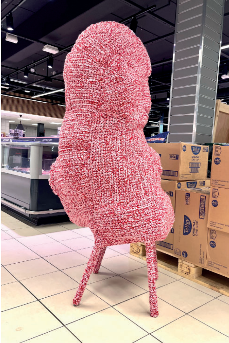
Randi Samsonsen: When Will You Come To See You Like I Do? Installation i Miklagarður, Tórshavn, 2022. Foto: Bárður Eklund. © Randi Samsonsen.

Det forekommer at være et åbent spørgsmål, der kan gå flere veje, alt efter om det er et filosofisk, eksistentielt spørgsmål, eller om det er beskueren, der spørger skulpturen, eller omvendt. Tekstilskulpturerne er antropomorfe med deres særlige materielle og formmæssige kropslighed. Skønhedsmæssigt er det mere Venus fra Willendorf end Venus fra Milo, der falder os ind, for figurerne er præget af en kluntethed, der er mere elskelig, end den er elegant, og forekommer som en del af kunstnerens strategi med henblik på at afvæbne beskueren mentalt. Skulpturerne minder i form om Barbapapa , en fransk børnebog fra 1970, som børn har været fascineret af lige siden 1970'erne. De er lette at tegne med en sammenhængende, bølgede konturstreg, og den formmæssige enkelthed er nok en af årsagerne til deres enorme popularitet. De formummede figurer er imidlertid også foruroligende flertydige, og man fornemmer noget skjult og bagvedliggende. Netop samme dobbelthed fornemmes i Randi Samsonsens skulpturer.