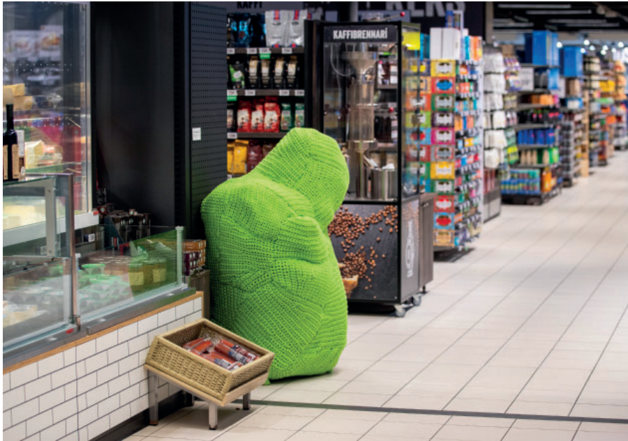
Randi Samsonsen: When Will You Come To See You Like I Do? Installation i Miklagarður, Tórshavn, 2022. © Randi Samsonsen.

og formmæssige karakteristika. Skulpturerne er bløde og flertydige og forekommer på en gang enkle og komplekse, håndgribelige og abstrakte, lune og mystiske, søde og faretruende.