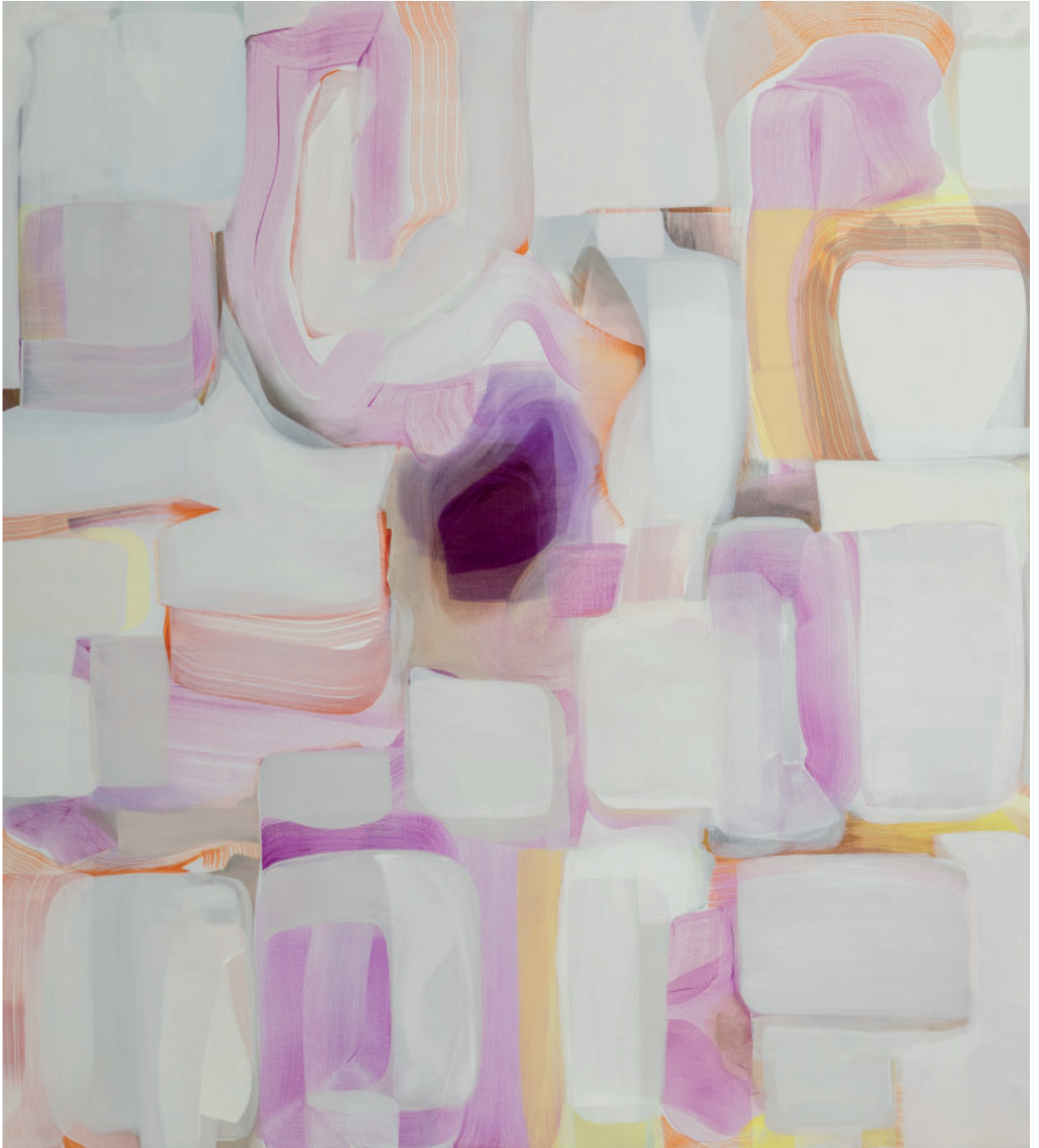
Hansina Iversen: Purple Rain , 2023. Olie og airbrush på lærred, 160x150 cm. © Hansina Iversen Foto: Finnur Justinussen.