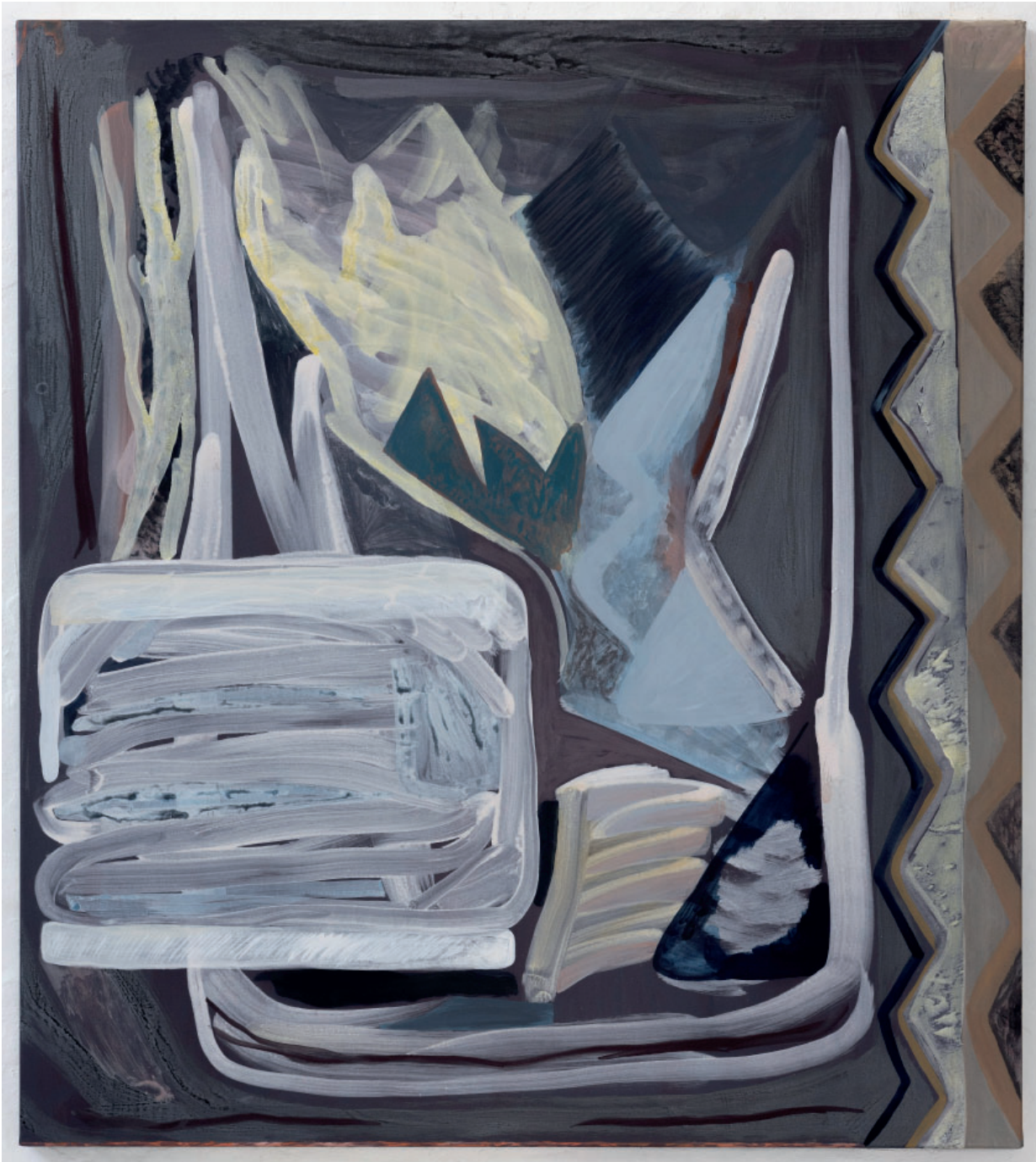
Julie Sass: Collage Painting , 2021. Akryl og pigment på bomulds lærred, 160x140 cm. © Julie Sass.