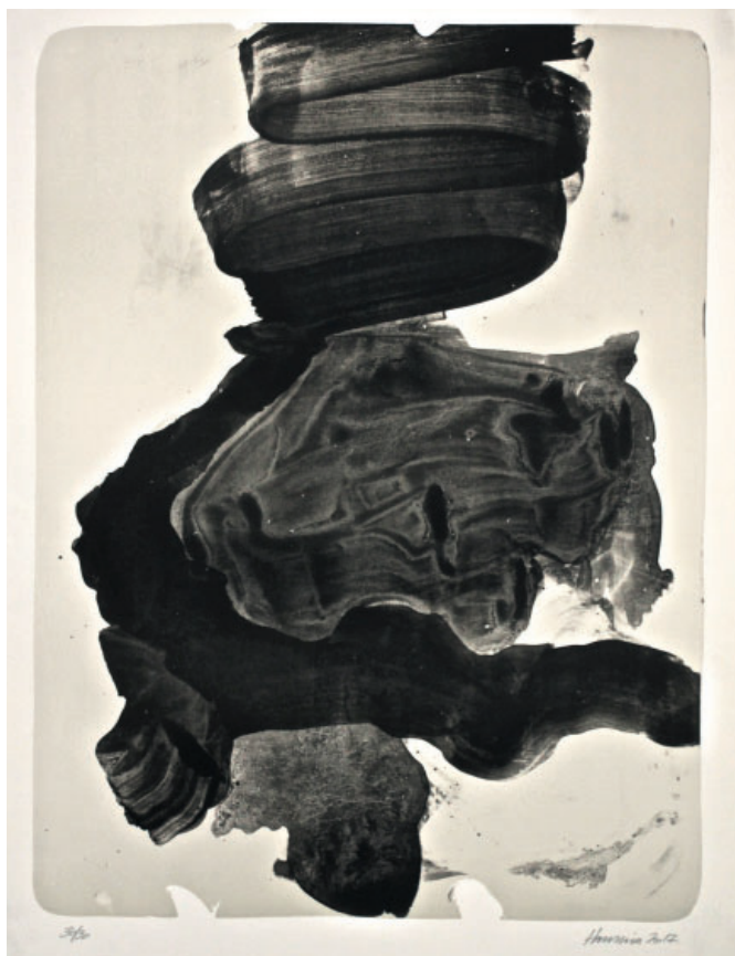
^ Hansina Iversen: Sepia , 2017. Litografi lavet i Steinprent . © Hansina Iversen.