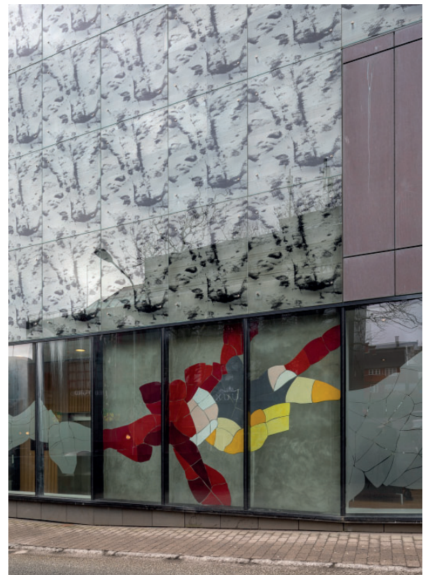
Hansina Iversen: Udsmykning af Løgtingið (Lagtingshuset), 2006. Silketryk på glas og udskåret bullseye glas. © Hansina Iversen.