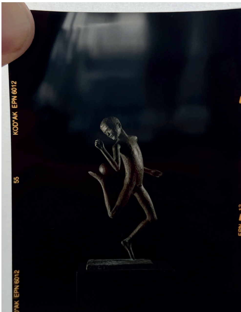
Janus Kamban: titel ukendt (dreng med bold), slut 1980'erne.