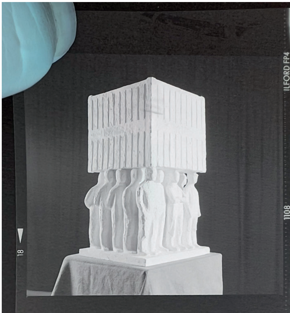
Janus Kamban: titel ukendt (mænd med container), ca. 1976.