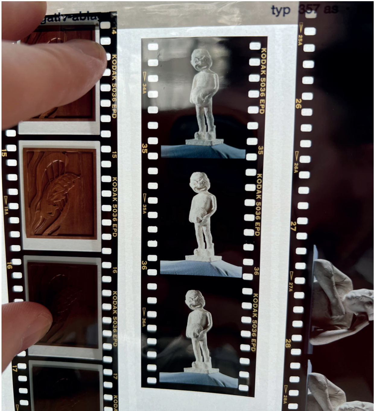
Janus Kamban: titel ukendt (figur med maske), ca. 1983. Foto af Ole Wich, affotograferet af Jóhan Martin Christiansen.