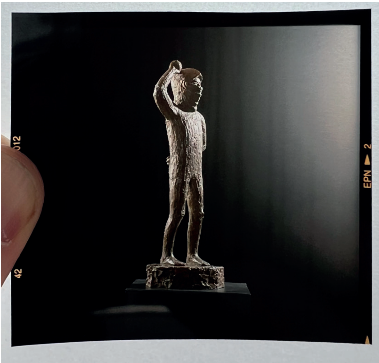
Janus Kamban: titel ukendt (protestfigur), 1980'erne.