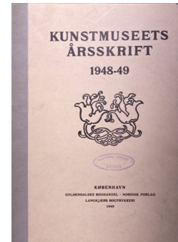
[1] Kunstmuseets Årsskrift , Statens Museum for Kunst 1948-49.

En del af digitaliseringsprojekterne, som KTDK har afstedkommet, har kastet efterfølgende forskning og publikationer af sig. Investeringen i kildernes tilgængeliggørelse og udkommet af samme er altså hurtigt tydelig, men også på længere sigt er det klart, at frigivelsen af tekster, noter, breve og andre skrivelser, der tidligere har været enten totalt ukendte, utilgængelige eller blot besværlige at komme i nærheden af, kommer til at forme en retning for den musealt forankrede forskning. I en artikel i Carlsbergfondets Årsskrift 2019 bliver det understreget, at Ny Carlsbergfondet som altid støtter erhvervelser til museernes samlinger af kunst snarere end afholdelse af særudstillinger, og at samme filosofi omkring at støtte det langsigtede snarere end mere flygtige begivenheder er en årsag til fondets støtte til KTDK. Museumsprogrammet, “Kilder til Dansk Kunsthistorie”, støtten til udgivelse af forskning i form af bl.a. museums kataloger og donatio-