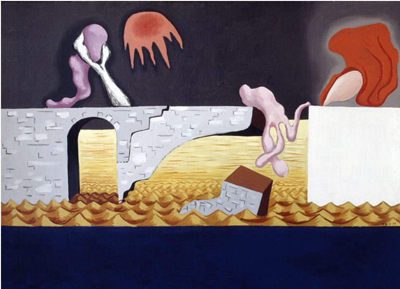
Vilhelm Bjerke Petersen: Den gamle bro styrter i havet , 1935, maleri (olie på lærred), 90,5 x 125 cm, Museum Jorn, Silkeborg.