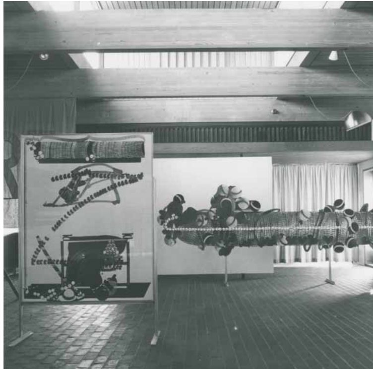
Carl Fredrik Reuterswårds værker på Pejlinger 66 .

idealistiske kunstformidlere indenfor.” 43 ). Senere på året blev en ny fløj med udstillingsrum til særudstillinger indviet, men under Pejlinger 66 var særudstillingen altså fortsat spredt ud over museets forløb, fra indgangen til havudsigten. Værker af alle kunstnere, med undtagelse af Mertz, blev indkøbt til museet, hvor eksempelvis Raysses Husker du Tahiti i september 61 (1963) var fremvist ved samlingspræsentationen Louisiana Classic i 2017. Alt dette understreger udstillingens centrale rolle i museets vision. Det kuraterede udvalg af samtidskunst skulle ikke bare orientere publikum, men også pejle museets samling.