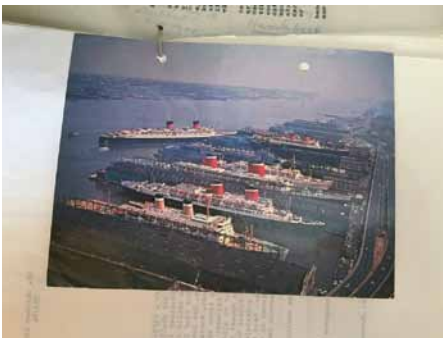
Postkort fra Öyvind Fahlström til Knud W. Jensen med afslag på at deltage i Pejlinger 66. Fra Louisianas arkiv.

svensk dialogudstilling. Fahlström, der ellers som skribent i Louisiana Revy var en god bekendt af museet, afviser dog i december 1965 via et kortfattet postkort fra New York 22 at deltage i udstillingen, bare to måneder før dens åbning – var en museumsudstilling for konform i forhold til den radikalt afsøgende kunstners selvforståelse?