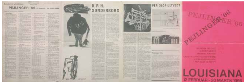
Udstillingsflyer fra Pejlinger 66 . Fra Louisianas arkiv. Foto: Kristian Handberg.