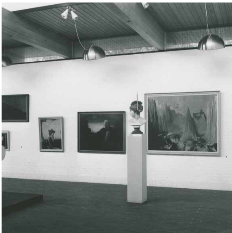
Wilhelm Freddie's værker på Pejlinger 66 .

skal i sådan en læsning nærmere ses som udtryk for en ny situation i forhold til den i starten af årtiet, som ansporede til pejling af modernismedebatten. Udvalget er selvfølgelig selektivt (og indeholder kun mandlige kunstnere) og måske ikke udpræget grænsesøgende, tidens eksperimentelle opbrud taget i betragtning.