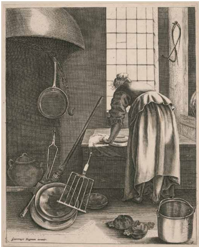
[3] Geertruyt Roghman: Kvinder og piger under huslig beskæftigelse , ca. 1640-47, kobberstik, 22 x 17,5 cm. Den Kongelige Kobberstiksamling © SMK Foto/Jakob Skou-Hansen.

udstillinger er det således fortrinsvist mandlige kunstnere, der registreres i databasen, og på den måde kan man sige, at det er de kunstnere, som allerede er kanoniserede, der igen bliver fremhævet.