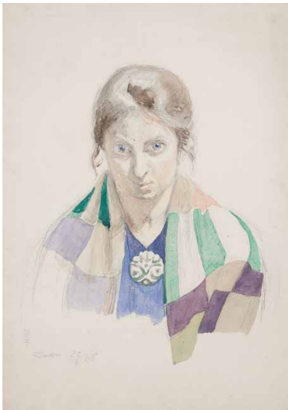
[2] Elise Konstantin-Hansen: Portræt af Olivia Holm-Møller , 1905, blyant og vandfarve, 36,7 x 25,3 cm. Den Kongelige Kobberstiksamling © SMK Foto/Jakob Skou-Hansen.

sig nogle dage i forvejen til Studiesalen, hvorefter man får en tid til at se de ønskede værker. Værkerne tages så ud fra magasinet, hvor de opbevares i kasser under styrede klimaforhold. Man skal altså vide, hvad man vil se fra samlingen, i modsætning til oppe i salene, hvor man kan gå rundt blandt de udstillede værker og opdage dem.