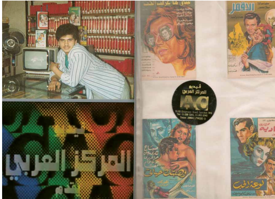
Fra CAMPs Pleasure: A Block Study (2013).

Edgware Road. På baggrund af interviews foretaget med diverse beboere, forretningsdrivende, repræsentanter for ejendomsforeningen Portman Estate og medlemmer af Edgware Road Traders Association vil jeg argumentere for, at CAMPs projekt først og fremmest har bidraget til synliggørelsen en række modstridende interesseforhold mellem henholdsvis ejendomsforeninger og migrantvirksomhedsejere i området. 21 Mere specifikt har projektet stillet skarpt på det faktum, at Portman Estate, der ejer størsteparten af ejendommene på Edgware Road, og områdets migrantvirksomhedsejere, der for størstepartens vedkommende er organiseret i Edgware Road Traders Association, i flere tilfælde har ligget i konflikt.