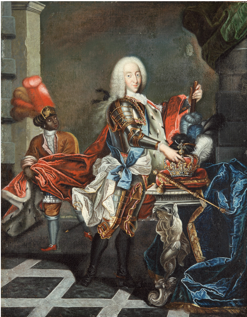
ILL. 3 Ukendt kunstner, Christian 6. , ca. 1740. Olie på lærred, 62 × 49 cm Det Nationalhistoriske Museum på Frederiksborg Slot.