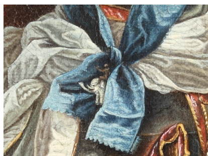
ILL. 5 Detalje.