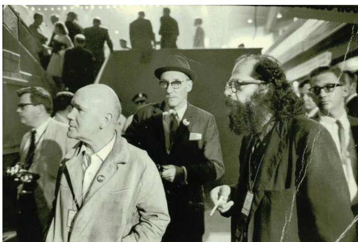
Jean Genet sammen med Allen Ginsberg og William S. Burroughs til demokraternes konvent i Chicago, 1968