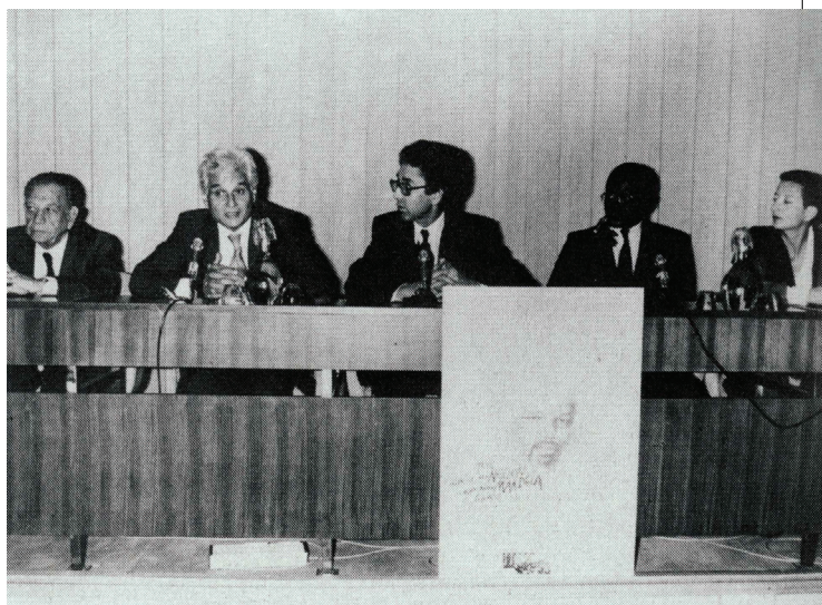
Pressekonference i UNESCO i Paris i forbindelse med publiceringen af bogen Pour Nelson Mandela , 1986.

tetiske retorik i appellen udtryk for? Begæret efter at anklage var slet ikke uproblematisk, for hvad var forholdet mellem dette begær og en egentlig refleksion? Hvem artikulerede denne anklage og hvorfra? Det var nødvendigt at stille disse spørgsmål for Derrida. Det betød ikke, at han i nogen banal betydning af ordet trak sig tilbage fra det politiske engagement, snarere var der tale om, som Jean-Luc Nancy skriver, at han “med skarpsindighed og omtanke i den stærke betydning af ordet [...] fornemmede det nødvendige i at forskyde engagementet i forhold til kanoniske tvangsmæssigheder, det vil sige i forhold til identitetsmæssige tvangsmæssigheder” (Nancy: 68).