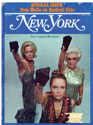
Forsiden på New York Magazine , juni 1970, hvori Tom Wolfes "Radical Chic: That Party at Lenny's" var trykt.