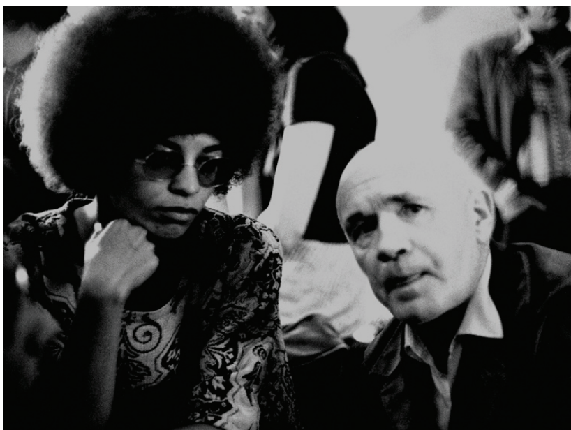
Jean Genet sammen med Angela Davies