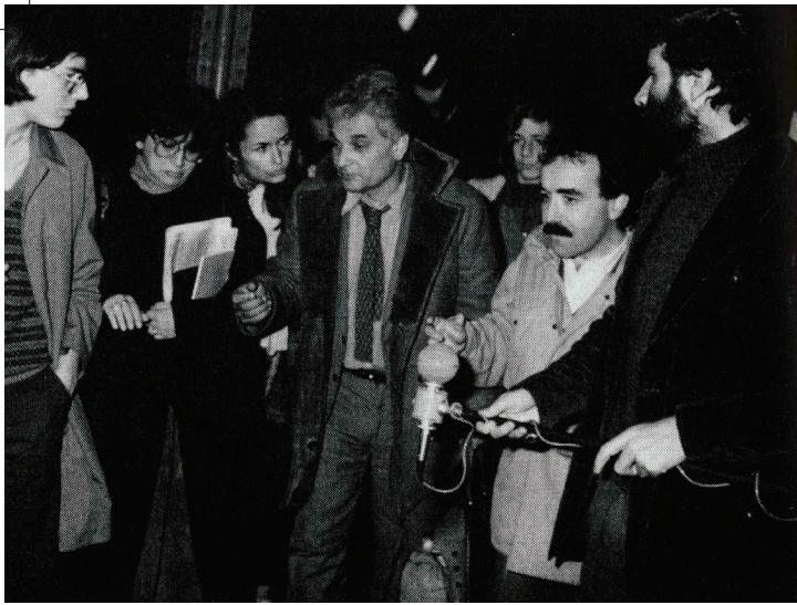
Derrida vender tilbage fra Prag efter at være blevet arresteret og tilbageholdt af det tjekkoslovakiske politi efter at have holdt møder med lokale dissidenter, 1982.

fængslet i en parisisk kulturoffentlighed, uden at være underlagt den hårde og brutale virkelighed, som Jackson var prisgivet. Det ville ikke ændre noget som helst, men blot bekræfte de allerede etablerede positioner: Fordi Jackson var sort, var han ingenting, var han i fængsel. Derrida og Genet derimod var frie til at engagere sig og sige fra. Den repræsentation havde Derrida besvær med at forlige sig med. Som han formulerer det: "Kommer vi nogensinde til at vide, hvem der fanger hvem på denne scene?" (ibid.).