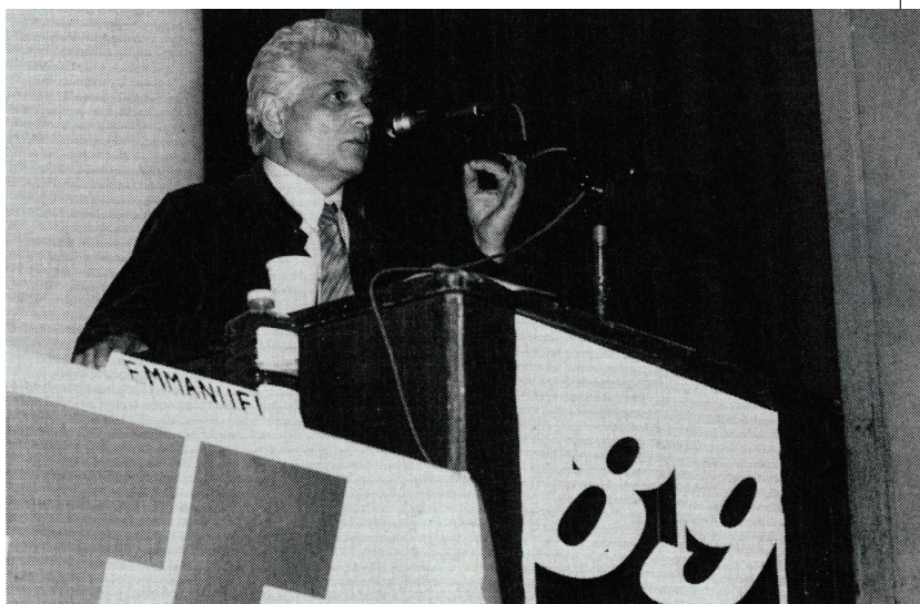
Derrida deltager i en konference om immigranternes ret til at stemme i Maison de la Mutualité, Paris, 1989.