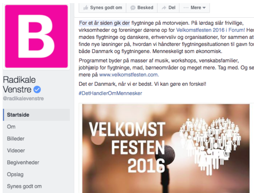
Figur 18: Radikale Venstre mener, at Velkomstfesten er Danmark, når “vi er bedst”

Samme dage deler det Radikale Venstre, også med reference til flygtningene på motorvejene året forinden, en begivenhed: Velkomstfesten 2016 (se figur 18). Forestillingen om, at Danmark kan være anderledes og bedre, er dominerende i begge opdateringer, og selvom det ikke er det samme Danmark, de forestiller sig, bidrager begge opdateringer til at vedligeholde det “forestillede fællesskab” (Anderson 1989) Danmark. Begge opdateringer vidner nemlig om, at de tager eksistensen af Danmark for givet. Dermed investerer begge opdateringer affektiv energi i forestillingen om Danmark.