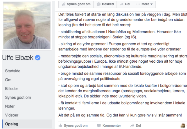
Figur 7: Uffe Elbæk reagerer på angrebet i Bruxelles den 22. marts.

Nye rytmer tilføjes den affektive struktur, når Elbæk bruger den globale mediebegivenheds rytme som afsæt til eksempelvis at diskutere EU’s ydre grænser og forebyggende arbejde i lokalområder.