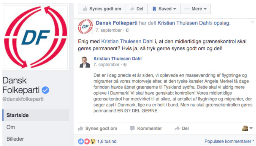
Figur 17: Dansk Folkeparti vil gøre grænsekontrollen permanent

Samme dage deler det Radikale Venstre, også med reference til flygtningene på motorvejene året forinden, en begivenhed: Velkomstfesten 2016 (se figur 18). Forestillingen om, at Danmark kan være anderledes og bedre, er dominerende i begge opdateringer, og selvom det ikke er det samme Danmark, de forestiller sig, bidrager begge opdateringer til at vedligeholde det “forestillede fællesskab” (Anderson 1989) Danmark. Begge opdateringer vidner nemlig om, at de tager eksistensen af Danmark for givet. Dermed investerer begge opdateringer affektiv energi i forestillingen om Danmark.