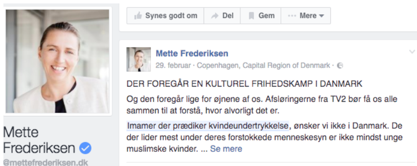
Figur 13: Mette Frederiksen erklærer frihedskamp