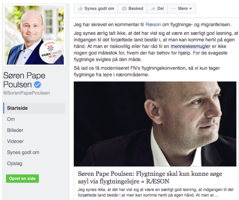
Figur 10: Søren Pape Poulsens opdatering om at flygtninge kun skal kunne søge asyl via flygtningelejre.

Mobiliseringen af skam er ikke den eneste affektive retningsgiver. Flere af opdateringerne bærer præg af forsøg på at afvise skammen gennem forskellige taktikker: “fight, flight, freeze, appease, or dissociate” (Tarakali, 2009). Dette ses både i forsøg på at motivere, formilde og retfærdiggøre lovgivningen. Socialdemokraternes Mette Frederiksen argumenterer eksempelvis for, at det er nødvendigt med en “balance”, at vi skal beskytte “velfærdssamfundet” og hjælpe i “nærområderne”, men “også herhjemme”. Afvisningen af skammen sker også i en mere konfrontatorisk form, når det Konservative Folkeparti og Søren Pape Poulsen (se figur 10) argumenterer for, at de asylansøgere, der kommer til Danmark, ikke er de svageste, fordi de har haft råd til en menneskesmugler, og at FNs flygtningekonvention skal moderniseres. Her omdirigeres skammen altså gennem argumentet om, at ved at hjælpe de flygtninge, der kommer til Danmark, overser man dem, der virkelig har brug for hjælp.