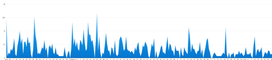
Figur 4. Opdateringer om grænsekontrol, flygtninge- og indvandrerpolitikken.

Efter optællingen af opdateringer om grænsekontrol, flygtninge og indvandrere kortlagde jeg de enkelte dages opdateringer. Dermed blev det muligt at identificere dage med peaks , altså dage hvor antallet af opdateringer er over gennemsnittet. Som det ses i figur 4, er debatten præget af store udsving: Der er meget få dage, hvor emnet slet ikke berøres, og der er en generel puls og særlige intensive dage og perioder. Jeg vil vende tilbage til, hvordan peakene og den gennemgående puls influerer debatten om grænsekontrol, flygtning og indvandrere nedenfor.