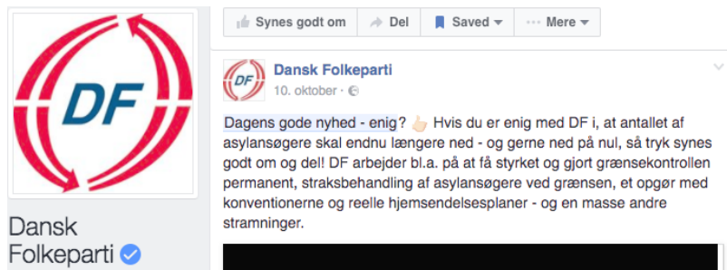
Figur 11: Dansk Folkepartis opdatering om lukningen af teltlejre