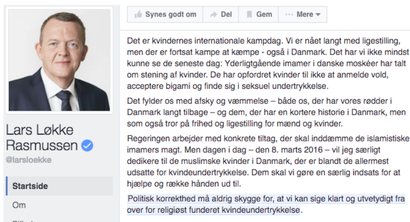
Figur 14: Lars Løkke Rasmussens opdatering på kvindernes internationale kampdag

Kontinuiteten i den affektive rettetthed og puls er interessant, fordi den indikerer, at der er serialitet i materialet. Jonathan Crary har en negativ tolkning af flowets og serialitetens betydning, idet han argumenterer for, at TV bryder med rytmer og introducerer en serialitet, der immobiliserer gennem “the numbing and ceaseless production of the same” (Crary 2013, 117). Her er han i forlængelse af Wilém Flusser, der frygter, at “in the future, all messages, especially models of perception and experience, will be taken in uncritically, that the informatics revolution could turn people into receivers who remix messages uncritically, that is, into robots” (Flusser 2011, 77). På sin vis vækker dette genklang i materialet, der viser, at der sker et remix af budskaber og brudstykker, som trækkes frem og kombineres som led i den affektive rettetthed og puls. Men den serialitet, der produceres i materialet, er ikke en immobilisering i produktionen af det samme. Serialiteten er affektivt ladet, og den virker som en aktualisering af de rytmiske intensivering. Det skyldes, at opdateringerne ikke blot producerer det samme, for de forbinder og retter affekt mod nye objekter – fra grænsekontrollen til imamer og børnehaver. Serialiteten er dermed central, ikke fordi den passiviserer, men fordi den holder den affektive rettetthed ved lige ved at skabe og reproducere “sticky objects” (Ahmed 2004), der kan glide ‘sideways between figures, as well as backwards by reopening past associati-