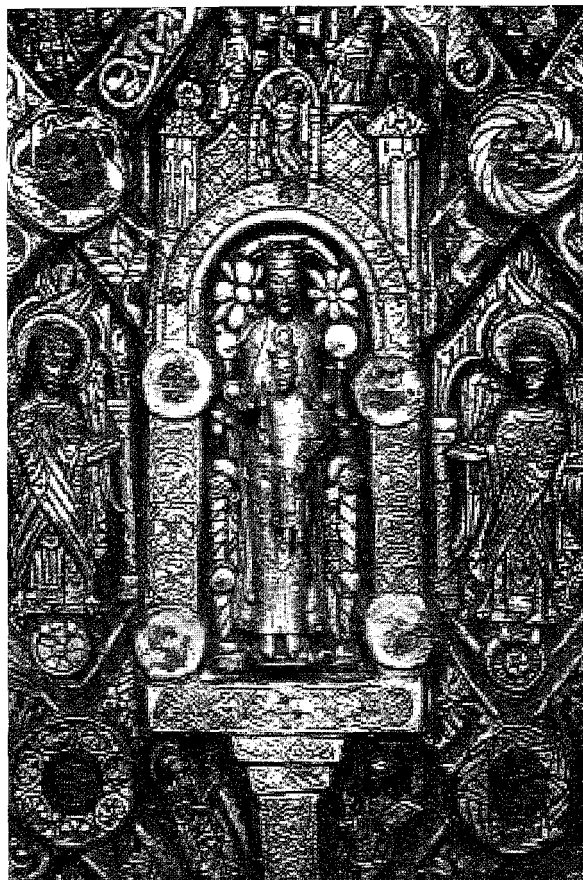
Fig.2. Hovedmotivet på det gyldne alterfrontale fra Lisbjerg kirke ved Århus, nu Nationalmuseet i København: Madonna med barn i indgangen til Det himmelske Jerusalem. Dendrokronologiske undersøgelser har vist, at værket formentlig er fremstillet i 1130'erne.

Det handler således igen om med udgangspunkt i det skabte at rette opmærksomheden mod Skabe- ren, hvilket som anført er middelalderens anagogiske princip . 8 Og "det skabte" er i denne sammenhæng f.eks. guldet og bjergkrystallerne, dvs. på den ene