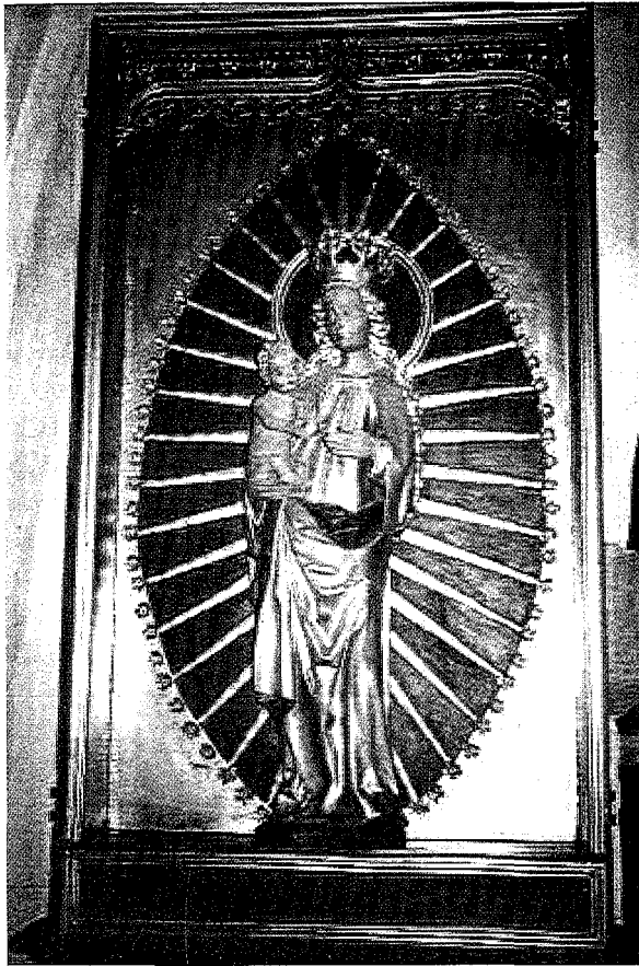
Fig. 3. Madonna med barn. Sidealtartavle fra o. 1500 i Henne kirke. Som i middelalderen er altartavlen også i dag placeret ved triumfvæggens nordlige del ind mod kirkeskibet.

en sub-skaber . Han kan ikke som Gud skabe noget af ingenting; men han kan vha. ingenting , nemlig form , så at sige give tingene mæle. I den forstand er tingene hellige: De siger noget om Sandheden , dvs. Gud. Ingenting er således ikke nødvendigvis det samme som intet , for når f.eks. et billede bringes til i én eller anden udstrækning at ligne det, det repræsenterer eller forestiller, da overføres der jo noget fra urbilledet ("motivet") til billedet, nemlig form . Det svarer til, at et stempel trykkes ned i voks, hvorved ren form , bogstaveligt talt ingenting , overføres.