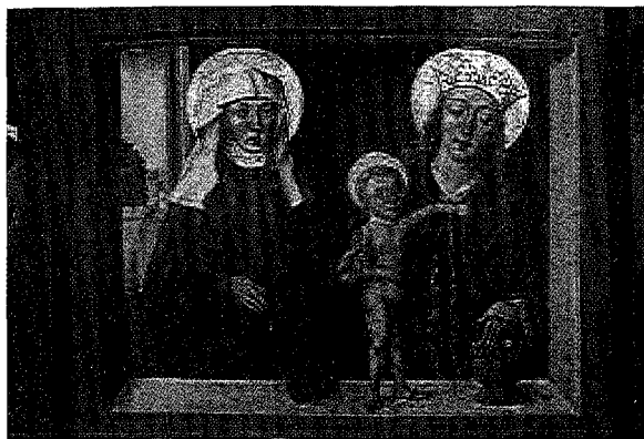
Fig. 4. Anna Selvtredje. Detalje fra højaltertavlen i Århus Domkirke. Leveret fra Bernt Notkes værksted i Lübeck 1479.

trækkende osv. Maria er en tiltrækkende ung kvinde, og Jesusbarnet er en lille nuttet baby. Men sådan er det ikke altid i den senmiddelalderlige kunst. På altertavlen fra 1479 i Århus Domkirke 26 ses blandt mange andre malerier i tavlens helt lukkede stand en fremstilling af Anna Selvtredje, dvs. Jesusbarnet med sin mor Maria og sin mormor Anna (fig. 4). Det