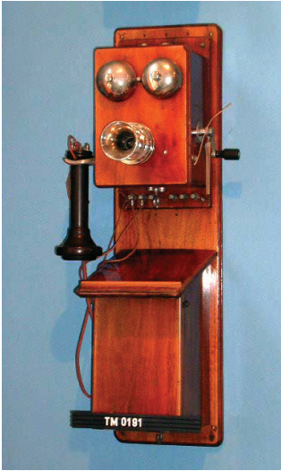
Væghængt telefon fra Store Nordiske Telegraf Selskab 1892

Den ængstelige og undrende distancering får hurtigt følgeskab af en intimitet mellem fortæller og telefon. Apparatet når mit Hjerte og trækkes hen mod mennesket i en antropomorferende beskrivelse af telefonen, der “hænger der med sine Klokkers to lukte Øjne og sin altid åbne Mund” (ibid.).