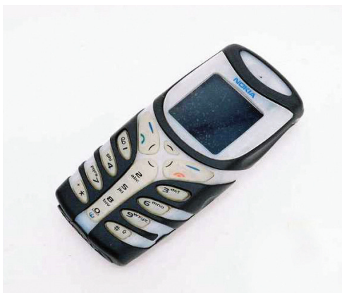
Nokia 5100 med gummiskal og lommelygte

Telefonen er ikke et mirakel, der forbinder mennesker og heller ikke et symbol på manglende kommunikation. Den er hverken frygtet eller tiljuble, men derimod noget, der blot er der , hvis “Bente” ellers vil findes.