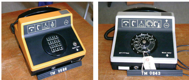
F79, GNT-Automatic, med hhv. taster og drejeskive.

et øjeblik på klartonen. Så lader hun kronen dumpe tungt og ned gennem sprækken. Men lægger røret på igen før hun får drejet nummeret. Plonk, siger det da kronen kommer ud, hun vipper den lille metallåge. Tager mønten og så gør hun det igen, kronen i og klartone, og denne gang lader hun den ringe. Længe. Og endelig tager Marianne telefonen. (127-128)