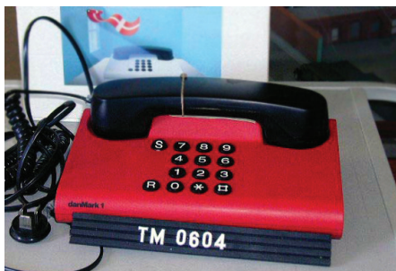
Tv. Nokia 2110 – en af de første mobiltelefoner med stor udbredelse. Th. danMark1 – fastnettelefon fra KTAS-området.