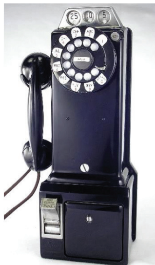
Tv. Claes Oldenburg: Soft Pay-Telephone (1963), vinyl med kapokfyld, (118.2 × 48.3 × 22.8 cm) Th. Western Electric Pay Phone (1950'erne)