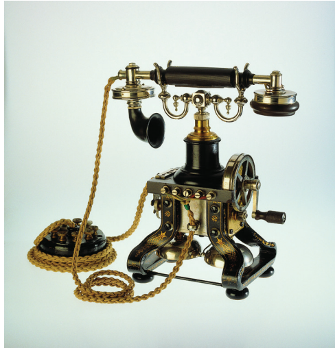
L. M. Ericsson-telefon. En såkaldt symaskine . 1895.

synkronisering af kærligheden: “Og han forstod. Og vaktes. Og forfærdedes. Og næste Dag var hun i hans Hjerte” (ibid.: 99).