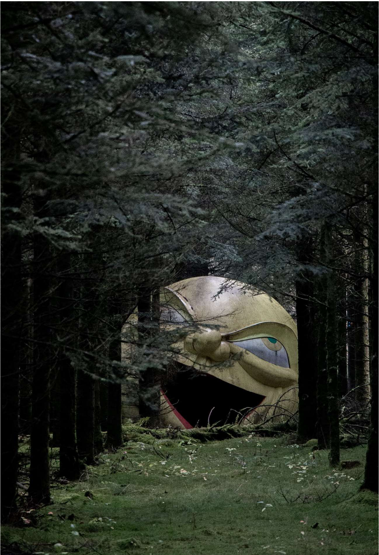
Peter Land: Falden Måne.