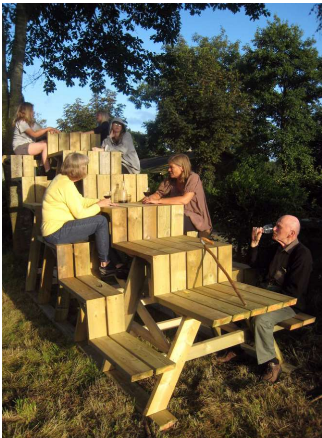
Søren Taaning: Etagébænk.

menneskabte kunst/kultur i den menneskabte trimmede natur. Hvad er natur, hvordan ser den ud – f.eks. landskabet? Hvordan skal vi forstå og tilpasse os den største langsomme krise vi har stået over for i forhold til biodiversitetskrisen, CO 2 , vandstand, Verdensmålene osv.?