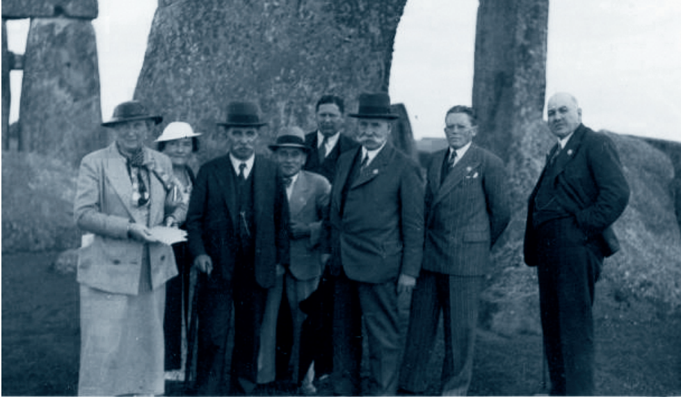
Note: Rigsdagens kloakudvalg på studietur til England i 1936.

Siden da blev folketingsrepræsentanterne i FN-delegationen degraderet fra at være officielle repræsentanter og har siden haft officiel status som suppleanter eller rådgivere. Nogle var utilfredse, mens andre satte pris på ikke at skulle optræde som repræsentanter for udenrigspolitikker, de ikke altid selv var enige i (Petersen, 1998: 120).