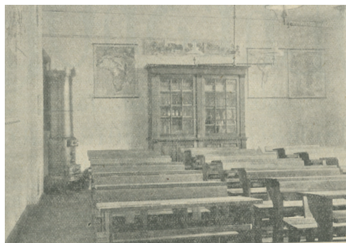
Billede 2: Fredensborg Centralskole (Folkeskolen 1907: 4)

gange, at eleven ikke vidste, om han/hun var under opsyn. Derudover blev eleven tidsligt disciplineret ved, at gangene blev udformet til bevægelse og ikke til ophold. Der var ikke stole eller bænke på gangene. Eleven blev kropsligt disciplineret via indretningen af klasselokalet, hvor eleven blev placeret i tomandspulte med front mod læreren og tavlen. (Breinbjerg og Drejer 2014: 8).