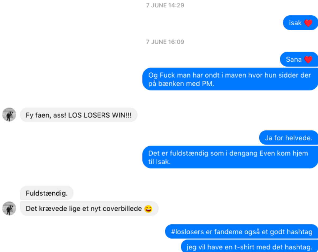
Figur 2. I SKAM opstår Los Losers under stor jubel, og vi ser her et eksempel på, hvordan vores forskningsposition blander sig med fankulturen i affektive udbrud, analyser samt konkrete, medierede handlinger.

Vores kontinuerlige samtaler handlede meget ofte om, hvor vi var, og hvordan vi kunne se (eller havde praktiske vanskeligheder med at kunne se) nye klip. Et par gange så vi et klip sammen, hvis vi tilfældigvis var fysisk til stede det samme sted, men som hovedregel så vi klip og andet indhold hver for sig (mere eller mindre synkront) og var i kontakt med hinanden via Messenger. Samtidig tog vi screenshots af væsentlige tråde og hændelser i kommentarfeltet på http://skam.p3.no/ og i de forskellige Facebookgrupper, vi fulgte. Ofte var det med det formål at dokumentere, hvordan en diskussion udviklede sig over tid; vi tog fx screenshots af potentielt interessante kommentarer, eller dokumenterede aktiviteten med screenshots umiddelbart efter et klip var offentliggjort, 10 minutter og en halv time efter, alt efter intensiteten i diskussionen. Hvis den ene af os var forhindret i at se et klip eller i at tage screenshots, prøvede vi at sørge for, at den anden gjorde det, se figur 3.