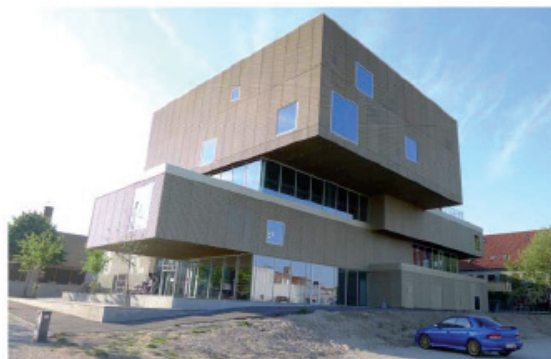
Figur 1. Som en stabel af bøger ligger bygningskompleksets forskellige afdelinger over hinanden. De forskyder sig i flere retninger og 'rækker' så at sige ud mod kvarteret. Bygningens performance signalerer, at den rummer mere end en funktion.

Gitte Marling, Professor, arkitekt ph.d., Institut for arkitektur og medieteknologi, Aalborg Universitet (marling@create.aau.dk)