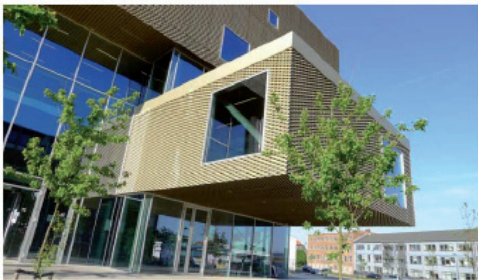
Figur 2. Bygningskroppen er opløst i flere enheder og betrukket med et metal - net, der er ført hen over flere af vinduerne. Ved at trække en af bygningsdelene ud over indgangspartiet skabes en udendørs rummelighed – et rum til velkomst. (Foto: Gitte Marling, maj 2012)

En tredje tendens er, at biblioteket eller bibliotek/kulturhuset involverer sig aktivt i lokalsamfundet på flere planer. Det kan være formelt ved at rumme en borgerservice funktion eller bydelskontor for byudvikling; men det kan også være mere uformelt ved at agere kvarterets dagligstue – eller lokale byrum. Et såkaldt ”tredje sted” (Soja 1996). Endelig kan det i et samarbejde mellem offentlige initiativer og frivillige rumme forskellige støttefunktioner for områ-