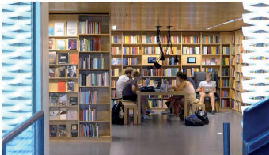
Figur 5. Halvlukket arbejdsblomme. Her er skabt en rolig atmosfære. De tunge materialer dæmper lyden af samtalen. Målet har formentlig været at skabe en oplevelse af det klassiske bibliotek. Trods de moderne møbler er bibliotekets klassiske arbejdsstemningen til stede.

Der er brug for et nyt arkitekturbegreb for arkitektur, der gør kroppen til centrum for oplevelsen. På samme måde som bibliotekets ledere og ansatte medarbejdere udfordres i deres vanlige forestillinger vedr. bibliotekets rolle, indretning, organisering og drift,