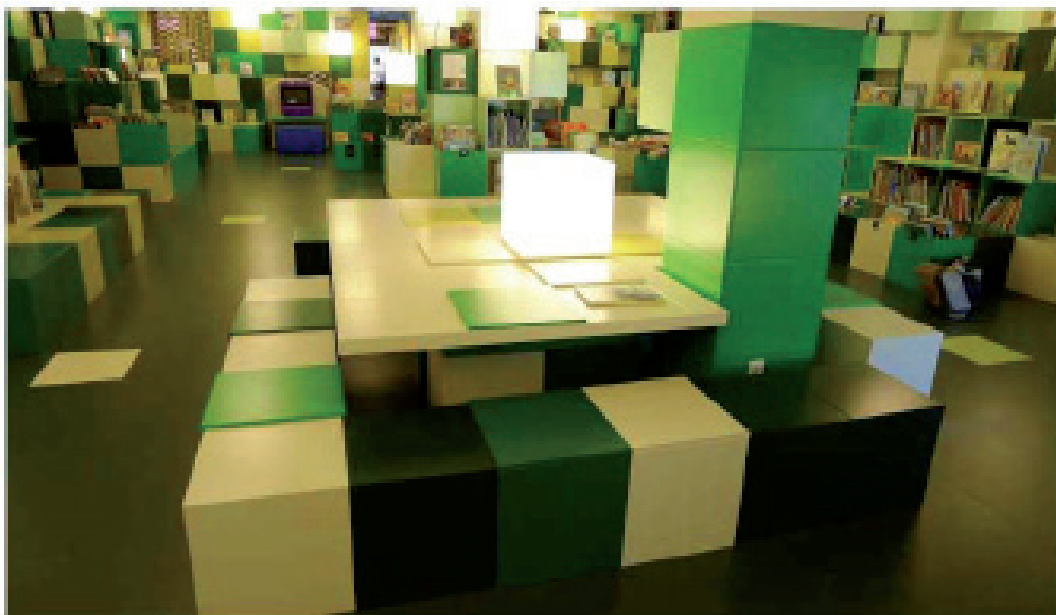
Figur 7. Børnebibliotekets klatrevæg. Der er anvendt et byggesystem af klodser, der kan minde om LEGOs klodser. Det er nærliggende at formode at arkitekterne har villet give rummet en for børn genkendelig kode for leg. Bibliotekarerne har imidlertid følt trang til at stille bøger frem over alt på klatrevæggen. De har åbenlyst set klatrevæggen som en reol.

De nævnte eksempler fra casestudier giver svar på spørgsmålet om, hvorledes bygningskompleksets enkelte funktioners egenart og identitet, kan underbygges med arkitektonisk formsprogs virkemidler.