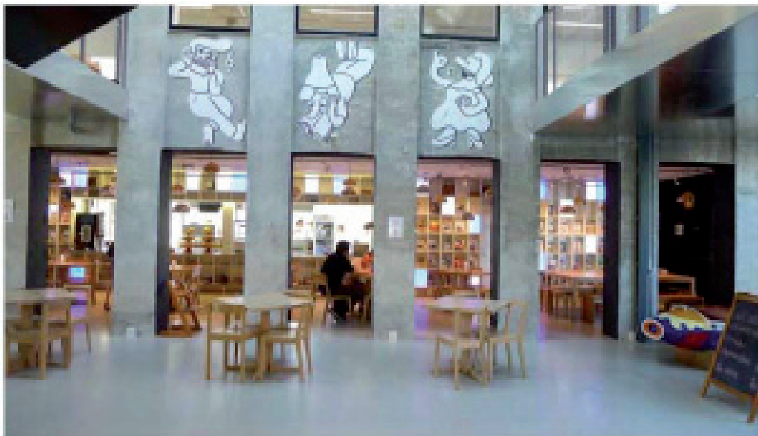
Figur 8. Kig fra børnebiblioteket ud i atriet / den indendørs gade og videre ind i cafeen og køkkenet. Huset er transparent på tværs, hvilket giver en oplevelse af det hybride kulturhus mange programmer. (Foto: Gitte Marling, maj 2012)

Der er ikke tale om en tilfældig valgt case, men derimod en bevidst valgt såkaldt 'ekstrem case' (Flyvbjerg 1991). Casestudiet har haft til formål via sin særlige karakter at vise, ikke hvordan biblioteksarkitektur i Danmark fungerer generelt; men derimod at vise, i hvilken retning udviklingen går med større og mere sammensatte og komplekse kulturprojekter, hvor biblioteket blot er et af mange programmer.