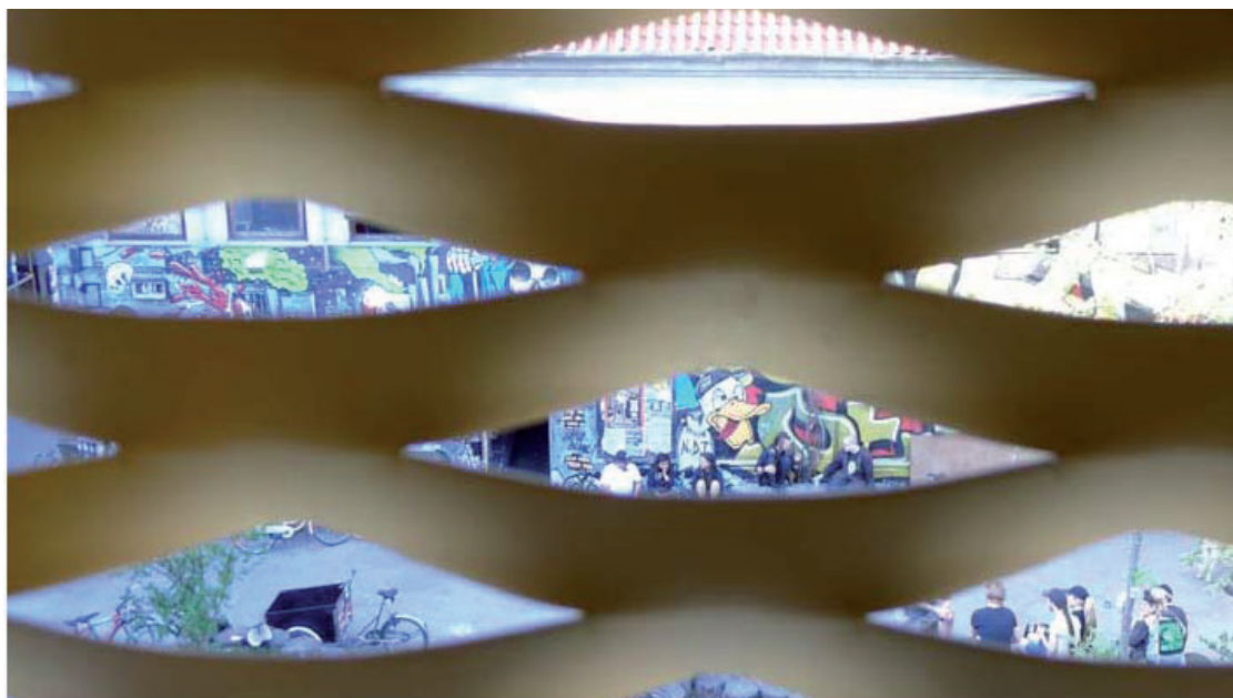
Figur 4. Et sjovt kig gennem metalgitterets masker ned i nabogården – Det er en overraskelse, at Ungdomshuset ligger så tæt på, og at de to kulturinstitutioner er så tæt forbundet. Hvilke potentialer er der mon i det? Udsigten giver anledning til eftertanke.

Med denne tilgang til æstetisk oplevelse sættes kroppen i centrum. Hvad betyder det, for den måde hvorpå arkitektur kan analyseres? Det efterspørger metoder, der både kan beskrive og kategorisere de arkitektoniske virkemidler; men også favne den holistisk sanselige oplevelse. Der er brug for en fæno-