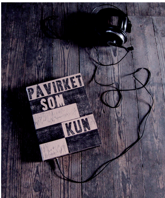
Illustration: Konrad Korabiewski

Denne artikel vil argumentere for, at den litterære kultur deltager i og udforsker bogmediets opbrud med stadig større tydelighed. Uanset om bogen er døende (hvilket jeg ikke tror), er litteraturens medier i opbrud, og derfor er der generelt og på bibliotekerne behov for en litteraturforståelse, der kan diskutere litteraturen som kunstform på tværs af medier og