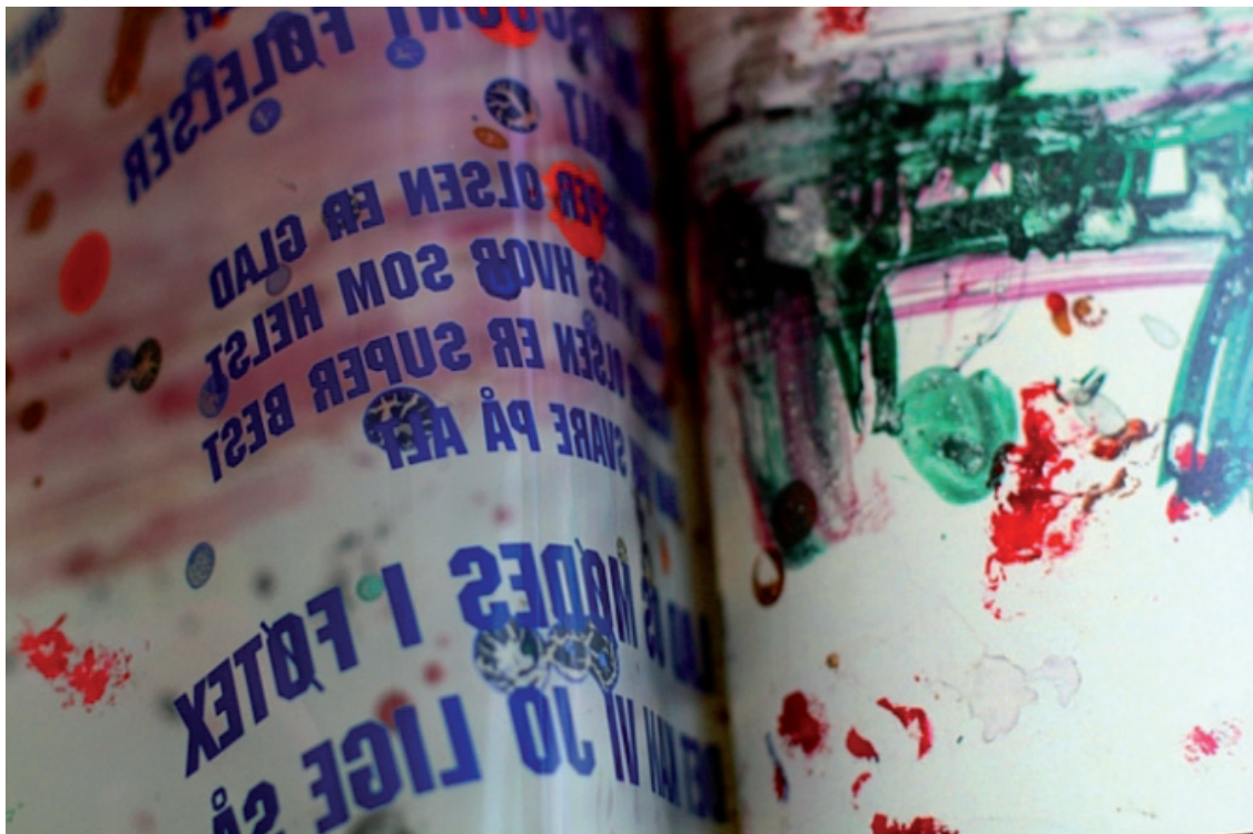
Illustration: Konrad Korabiewski

Efter denne gennemgang af e-bogen, og med Stripphas gennemgang af trykkeskærmens senalder in mente, kunne man fristes til at bebrejde teknologien denne udvikling – det er jo trods alt teknologien, der muliggør denne dematerialisering af bogen og efterfølgende tracking og overvågning af læseren. Dette står imidlertid i skærende kontrast til de visioner, som var fremtrædende ved introduktionen af digital litteratur, som ofte blev set som demokratisk, dialogisk og frigørende for læseren og læsningen og blev hilst velkommen med generelle udsagn, som "hypertext does not permit a tyrannical, univocal voice" (Landow, 1992, p. 11). I mellemtiden er teknologien blevet mere moden, og der foregår tydeligvis en indædt kulturkamp mellem en kultur- og litteraturindustri, der forsøger at forstærke og forsikre deres forretningsmodeller gennem principperne om kontrolleret forbrug og på den anden side kunstneriske eksperimenter