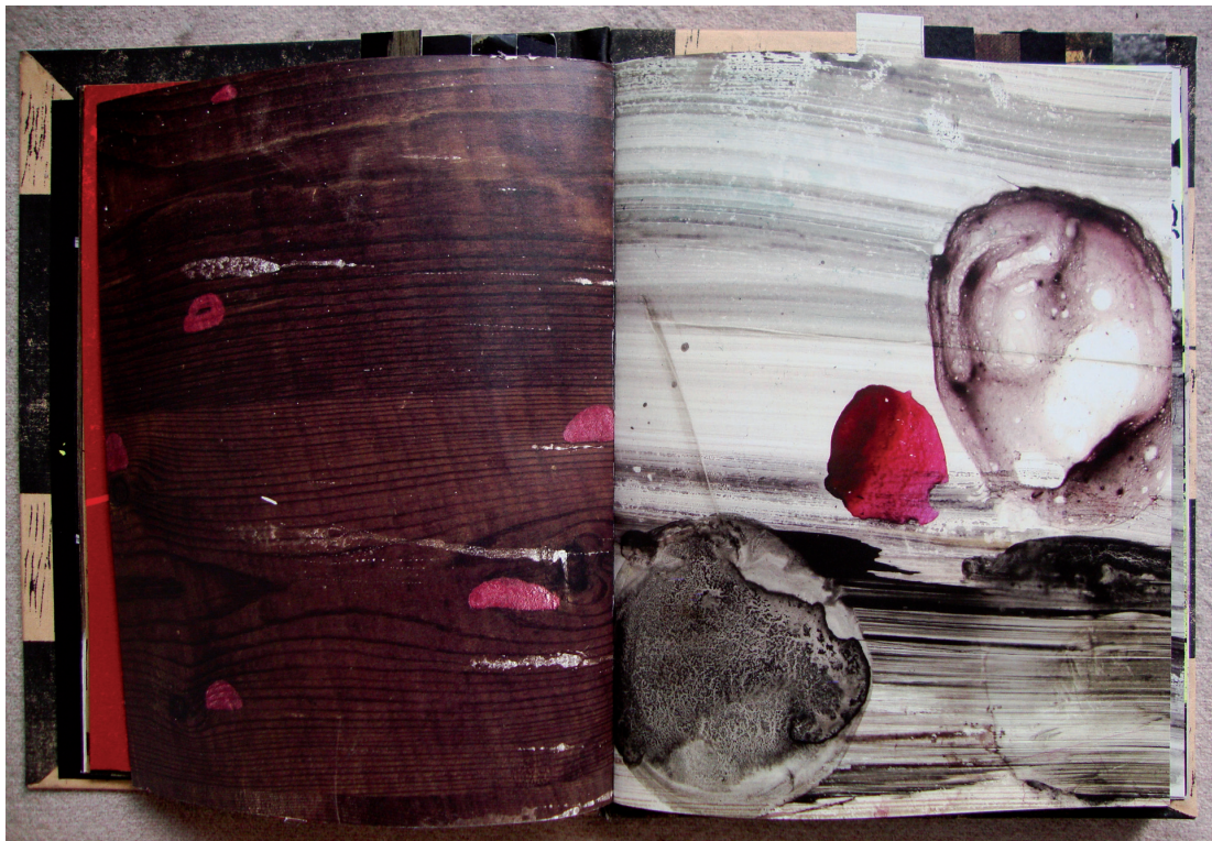
Illustration: Konrad Korabiewski

”it draws attention to the ways in which the social, economic, and material coordinates of books have been changing in relation to other media, denser forms of industrial organization, shifting patterns