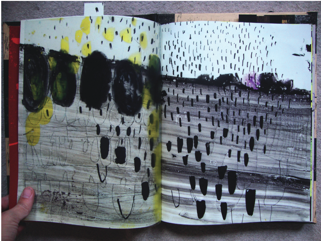
Illustration: Konrad Korabiewski

til at skrive noter etc. Der er tydeligvis lagt vægt på at skabe en rolig læseoplevelse á la bogens fjernt fra computerens multitasking, afbrydelser fra indkomne mails, sociale netværk, software der skal opdateres eller nettets distraherende reklamer og links, der lokker læseren videre og væk fra den tekst, han/hun læser.