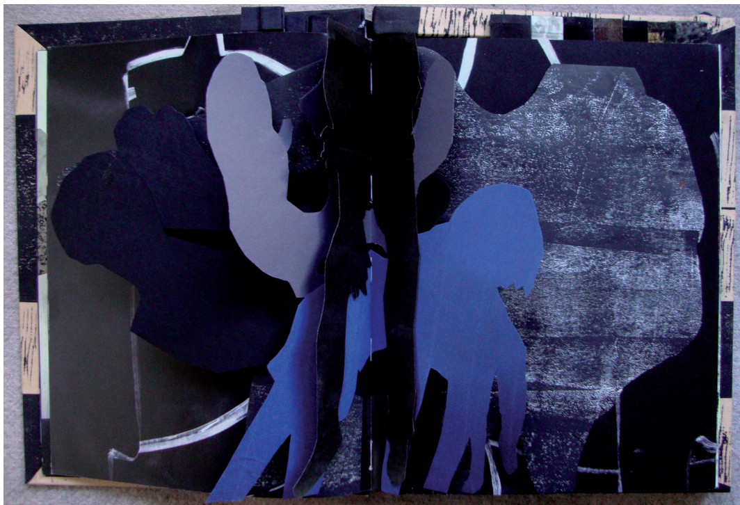
Illustration: Konrad Korabiewski

Der er ingen tvivl om at Amazons Kindle og Påvirket... er meget forskellige bogformater, der tjener vidt forskellige formål, og pointen er naturligvis ikke, at de indtager en sammenlignelig placering i trykkeskærmens senalder. Men der foregår en litterær kulturkamp, som det også er vigtigt for bibliotekerne som centrale litterære institutioner at tage bestik af og agere i forhold til. Hvordan denne kulturkamp falder ud har stor betydning for den litterære kulturs fremtidige vilkår – herunder hvilken plads der vil være til bibliotekerne og deres traditionelle rolle i forhold til at formidle, dele og låne litteratur ud og på denne måde medvirke til at danne en litterær offentlighed. Det handler ikke kun om for og imod digitalisering – digitaliseringen er allerede et vilkår – men om hvordan digitaliseringen iværksættes, hvad den bruges til, hvordan den ud-