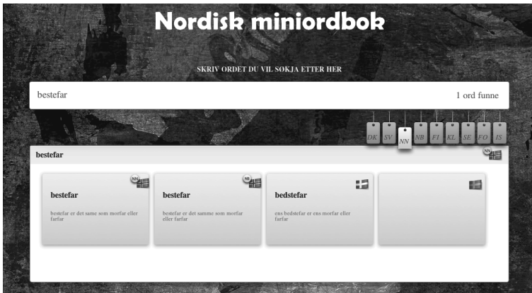
Figur 1: Nordisk miniordbok.