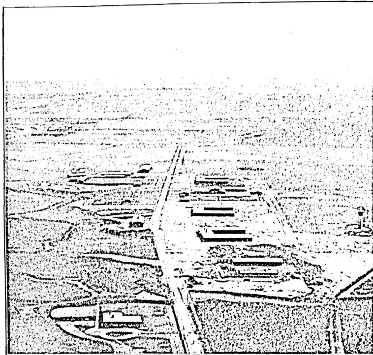
Flyverfotografi optaget 1935 under Byggearbejderne. Bygningerne grupperer sig om en nyanlagt Vej, for Enden af hvilken Helbredelsesanstalten for Drankere kan skimtes.

Anlæg m. v.. Arbejdshuset, der oprindeligt var underlagt Statsfængslets Inspektion, blev fra 1. April 1935 udskilt som selvstændig Anstalt med egen Ledelse og Administration. I 1936 blev til Arbejdshuset knyttet Statens Helbredelsesanstalt for Drankere med Plads til 23 indlagte og opført