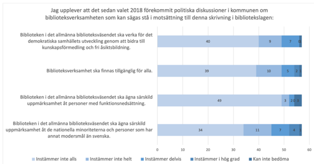
Figur 2. Motsättningar mellan skrivningar i bibliotekslagen och lokala politiska diskussioner. Fördelning av antal svar per fråga (n=57).

Även för det tema i enkäten som rör frågor om vad informanterna bedömer vara beslut eller diskussioner som står i motsättning till de prioriterade skrivningarna i Bibliotekslagen visar resultaten på en relativt liten förekomst av motsättningar, vilket framgår av Fig. 2. Dock förekommer en synlig skillnad mellan olika prioriteringsområden.