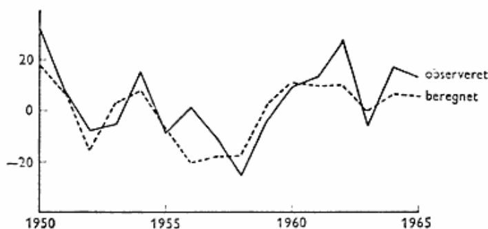
Figur 2. Merimporten af varer og tjenester i promille af bruttonationalproduktet

I den betragtede periode – 1950-1965 incl. – har den internationale økonomi været præget af en relativt stabil højkonjunktur og stigningerne i lønniveauet har her i landet ikke afvejet markant fra udviklingen i det øvrige Vesteuropa. Det er derfor en nærliggende hypotese, at ændringerne i saldoen på vare- og tjenestebalancen først og fremmest kan henføres til ændringerne i den indenlandske økonomiske aktivitet og eventuelt tillige bytteforholdet i udenrigshandelen. Disse antagelser har da også spillet en fremtrædende rolle i den hjemlige økonomiske debat – jævnsides med advarslerne mod overdrevne lønforhøjelser.