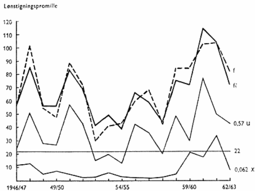
Fig. 1. f_1^* = 0,57 u + 0,062 x + 22 (jfr. tabel 7).