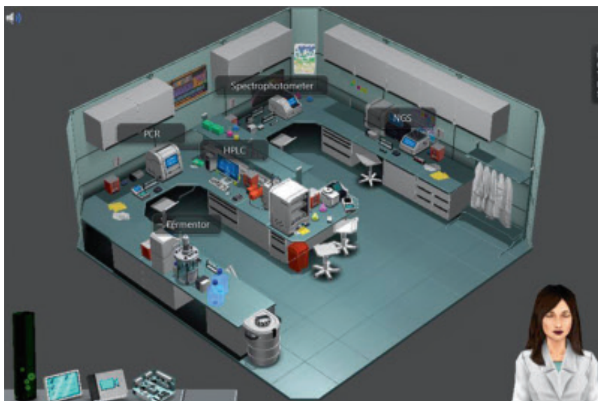
Figur 2. Labsters virtuelle laboratorium med en række virtuelle instrumenter (PCR, HPLC, spektrofotometer osv.) der indgår i forskellige øvelsescases.

ophobes i kroppen fordi det næste enzym i nedbrydningsprocessen ikke kan “følge med”. Eleven eller den studerende hjælpes igennem den virtuelle øvelse af en virtuel laborant. Undervejs arbejdes der med mange af emneområderne der knytter sig til enzymer (jf. figur 1), herunder også mange af de teoretiske områder der typisk giver de studerende problemer, såsom etableringen af enzymatiske assays og analyse af enzymhæmmerforhold. I det følgende vil vi beskrive nogle vigtige aspekter af den virtuelle øvelse.