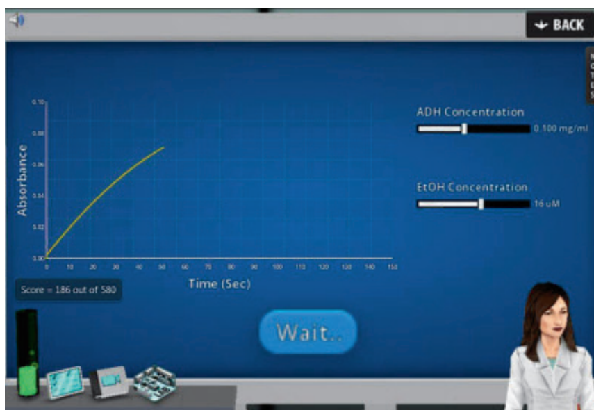
Figur 4. Simulering af enzymatiske reaktioner ved forskellige enzym- og substrat-koncentrationer. Simuleringer benyttes til at vælge betingelser som giver resultater i spektrofotometerets måleområde. Studerende kan justere niveauet af ADH (enzym) og alkohol (substrat) via skalaerne til højre.