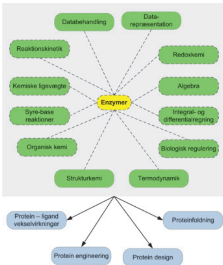
Figur 1. Faglige synergier i enzymundervisningen. Undervisning i enzymer kræver kendskab til en række naturvidenskabelige emneområder (grønne bokse). Samtidig kan læringsmæssigt fokus på enzymer bidrage til en bedre forståelse af de forskellige relevante emneområder (stiplede linjer). Desuden bliver den faglige synergi mellem emneområder klar og skaber basis for mere avanceret undervisning og forskning (grå bokse).

de reaktioner der er med til at regulere biologiske systemer, ville ikke forløbe med tilstrækkelig høj hastighed uden hjælp fra enzymer. Et eksempel herpå er nedbrydning af sukrose, også kendt som stabilt bordsukker som man kan have stående ved stuetemperatur i årevis uden nævneværdig spaltning til glukose og fruktose. Det første trin i nedbrydning af sukrose katalyseres af enzymet sukrase, og uden enzymer ville den energidannende omdannelse ikke finde sted på en fysiologisk relevant tidsskala.