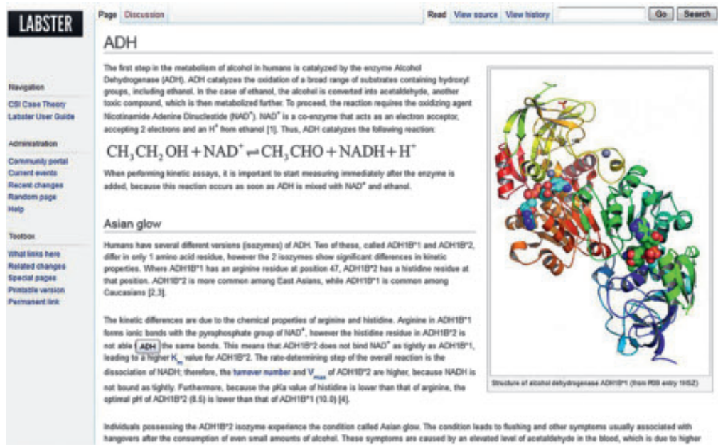
Figur 3. Labsters wikiinformation om ADH og Asian glow.

der også arbejder eksperimentelt med enzymkinetik, "tvinges" til at interessere sig for apparatur af relevans for enzymkinetik.