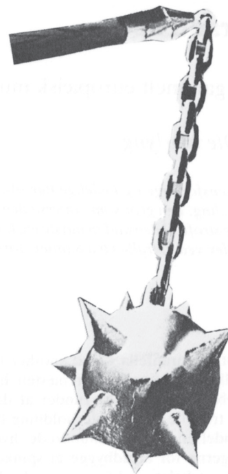
Middelalderens morgenstjerne – bare ét af Heavy Metals symboler på magt og autoritet.