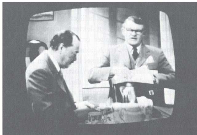
Henning Christiansen "glemmer" Scherfigs samfundskritik i dialogen mellem justitsministeren og politipræsidenten.

personers indblanding i edderkopaffæren). Han laver en fiktion, som både tillader ham at digte til og at hænge genkendelige personer ud. Føljetonens specielle styrke er, at den i hvert af de 59 afsnit dels lader kriminalhistorien udvikle sig dels perspektiverer historien med en kritik af pressen, socialdemokratiet, CIA, politiets forbindelse med Gestapo under krigen og nu med CIA, dommerstandens ynkelige "uafhængighed", skolevæsenet, borgerskabet og dets dobbeltmoral osv. osv. Hermed udtrykker han som DKP'er skuffelsen over, at borgerskabet blev genrejst, skuffelsen over at Socialdemokratiet lavede skinforhandlinger med DKP om en sammenslutning, skuffelsen over at den kolde krig og antikommunismen blev kørt så massivt af pressen og Socialdemokratiet, at befrielsesårets begejstring for kommunisterne i løbet af et par år vendte til had i den brede befolkning. Disse politiske pointer mangler i Henning Christiansens opera. Her er historien reduceret til krimihandlingen. De politiske moralismer, i føljetonen 59 stk.,