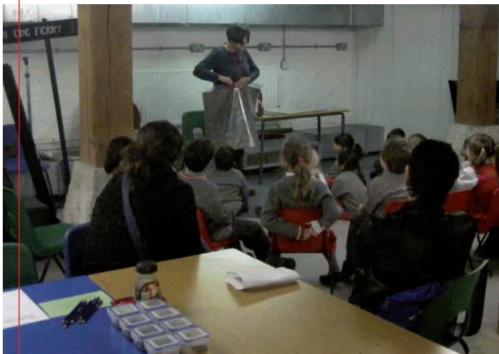
Et af undervisningslokalerne i kælderen på Museum of London Docklands, hvor en 2. klasse lærer om handel og varer i 1800-tallet.

One of the education rooms in the basement of the Museum of London Docklands, where a second grade is being taught in trade and goods.