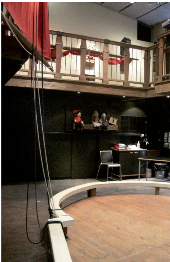
Undervisningslokalet Alla ombord på Vasamuseet, hvor svalegangen er synlig øverst.