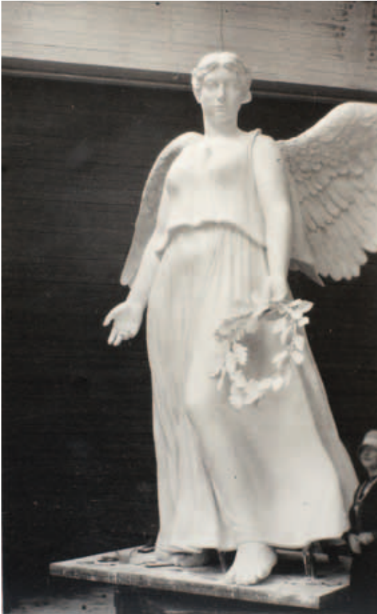
Fig. 11. Svend Rathsack: Originalmodel af englen i gips. Danmarks Kunstbibliotek, kasse 325, 120