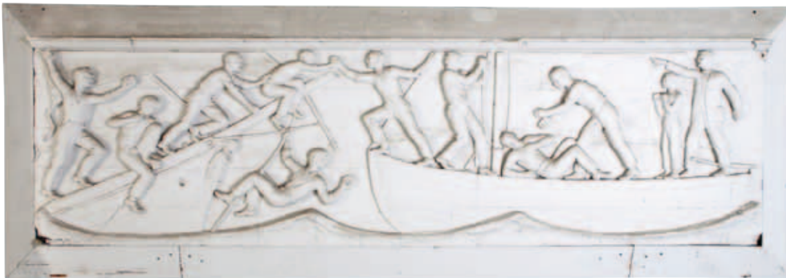
Fig. 6. Svend Rathsack: Skitsemodel af det nordøstlige relief. (1925). Gips. Sankt Hans Gade, København.