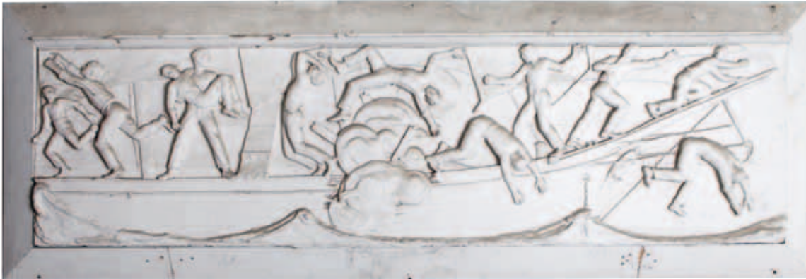
Fig. 5. Svend Rathsack: Skitsemodel af det sydøstlige relief. (1925). Gips. Sankt Hans Gade, København.