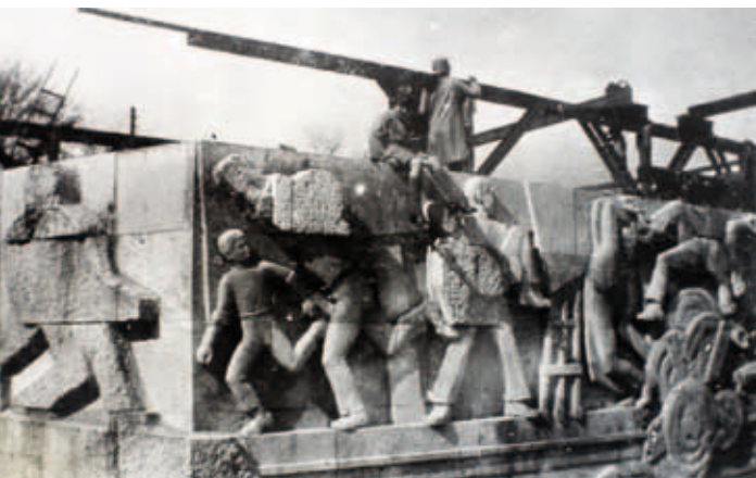
Fig. 9. Dele af det sydvestlige og det sydøstlige relief under arbejde. (Ca. 1925-26).