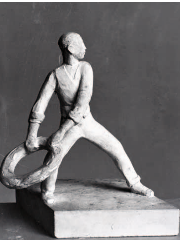
Fig. 2. Svend Rathsack: Mand der kaster en redningskrans . 1924. Statuette (første modellerede udkast). Betegnet: "SR [monogram] –24". Gips. 23,5 x 21 x 16 cm. Gave 1944. Statens Museum for Kunst, Inv.nr. KMS6030. Danmarks Kunstbibliotek, kasse 324, nr. 110b.