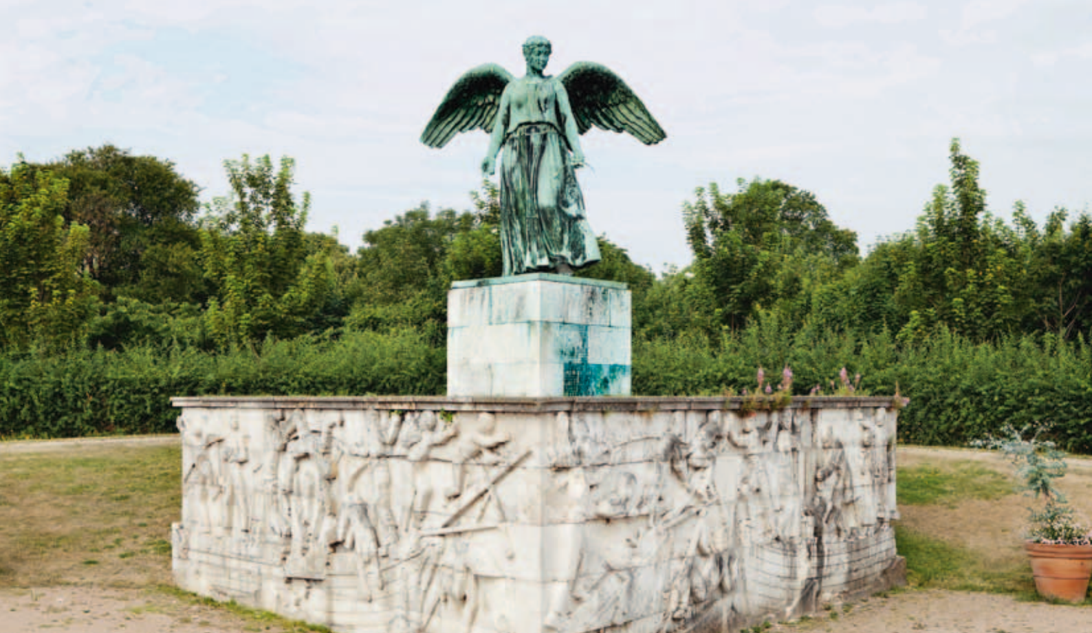
Fig. 1. Svend Rathsack og Ivar Bentsen: Søfartsmonumentet . 1928. Faksekalksten og bronze. Langelinie.