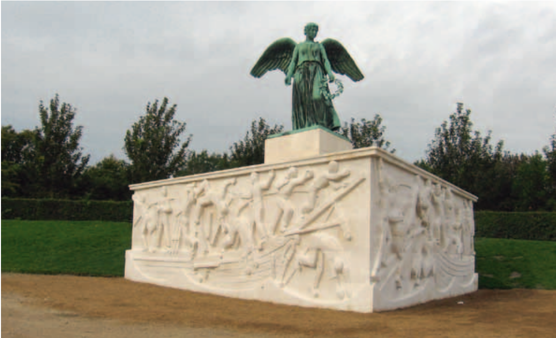
Fig. 16. Svend Rathsack og Ivar Bentsen: Søfartsmonumentet efter reoveringen . 2011. Toskansk travertin og bronze.