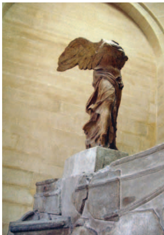
Fig. 13. Nike fra Samothrake . Ca. 190 f. Kr. 245 cm. Parisk marmor. Musée du Louvre, Paris.