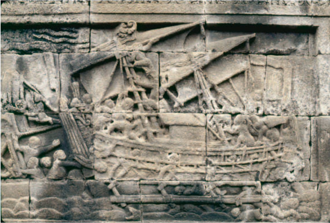
Fig. 12. Skib. Relieffelt fra templet i Borobudur, opført 778-842.