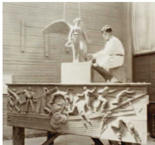
Fig. 7. Svend Rathsack oven på lermodel i reduceret størrelse af det sydøstlige relief og englen.