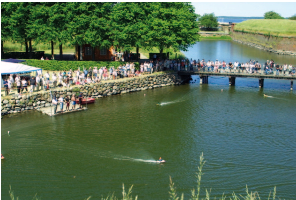
Modelskibssejls i voldgraven ved Würtembergers Ravelin, Kronborg 1. juni 2008.