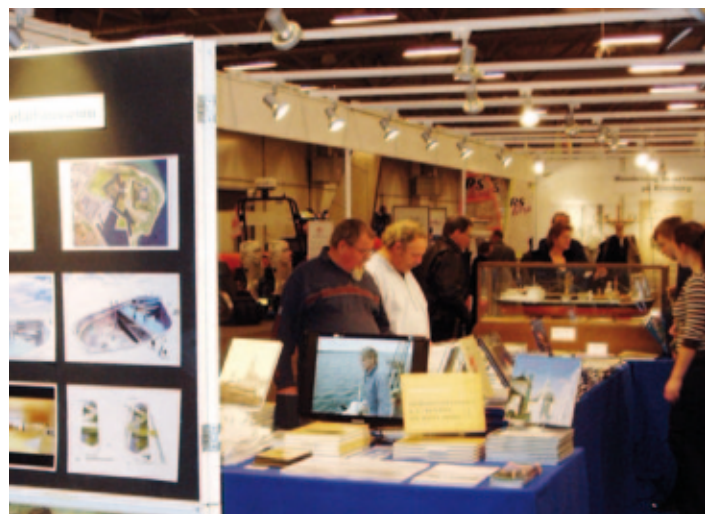
International Boat Show i Bella Center. Handels- og Søfartsmuseets store stand rummede bøger, skibsmodeller og en plancheudstilling om det nye søfartsmuseum.

Det drejer sig bl.a. om en større samling porcelæn og glas fra rederiet A.P. Møller, modtaget fra A.P. Møller-Mærsk; fire skibsfotografier, fra Jørgen Bendixen; skibsportræt af R. Chappel, fra Helga M.E. Groth; en samling messingskilte brugt ved mærkning af kasser til afskibning fra Københavns Havn, fra Claes Hagstrøm; en