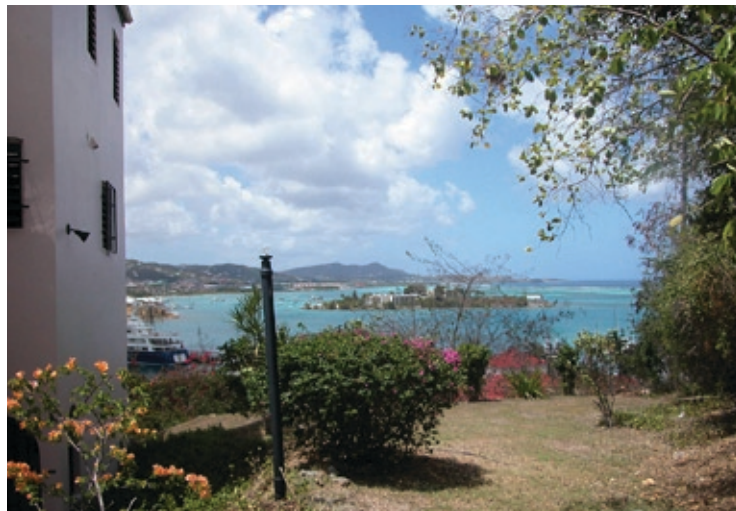
Nutidigt motiv med udsigten fra Mount Welcome ud over Christiansted.

ganske urørt og jomfruelig. Nogle af de mest populære strande i Caribien findes ved øens nordkyst. Mest kendt af disse er Trunk Bay, der flere gange er blevet valgt som en af de bedste strande i verden. Det forhold, at der er tale om nationalparkområde, gør, at disse vindunderlige strande alle er åbne for offentligheden og fri for hoteller og resorts. Det meste af den øvrige kyst, fortrinsvis mod nord og øst, er privat ejet og hjemsted for flere afsondrede og luksuriøse villaer. For det knapt så velbeslåede publikum stiller den nationale park service to områder