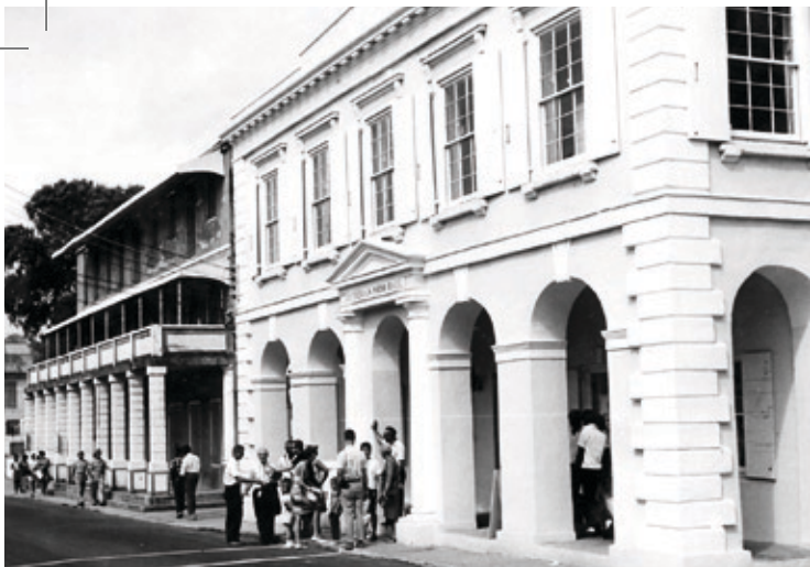
Foto optaget af Henningsen i 1967 visende den lutheranske præstegård og den tidligere danske skole i Christiansted.