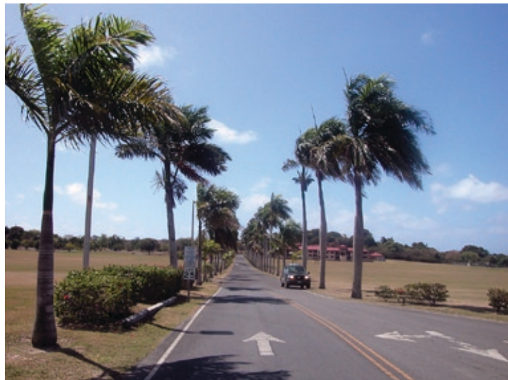
Billede af den tidligere plantage Golden Grove, der i dag huser University of the Virgin Islands.

Transporten til og mellem øerne er et kapitel for sig. Historisk har øerne altid været afhængige af transport ad søvejen. Det var kutyme, at sejladsen fulgte orkansæsonen, således at de fleste skibe ankom og afrejste om foråret. Det betød en begrænset kommunikation med Danmark, og det betød, at det kun var om foråret, man kunne få de varer, der ikke blev dyr-