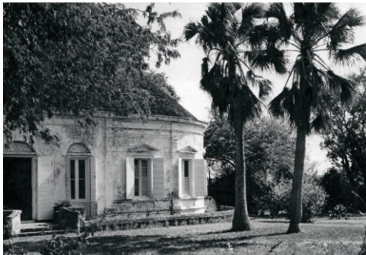
Billede af Whim Estate anno 1967.