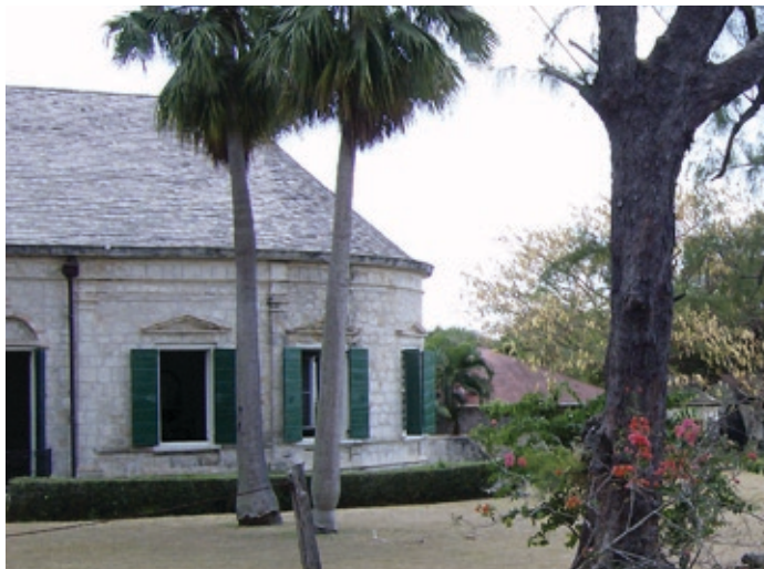
Billede af Whim Estate anno 2007. Som det var tilfældet, da Henningsen var forbi, fungerer stedet i dag stadig som et meget levende og spændende plantagemuseum.

Den skønhed og romantik, der i dag præger øen, røber ikke meget om øens spændende, men også blodige fortid. Øen blev koloniseret for første gang i 1718 af det Vestindisk-Guineiske Kompagni. I 1733 blev St. John et af de første steder, hvor et større slaveoprør brød ud. I seks måneder lykkedes det for slaverne at overtage og holde øerne, indtil danskerne med hjælp fra franskmændene på Martinique atter fik overtaget over øerne. Mange slaver valgte ved denne lejlighed at begå selvmord ved at springe ud fra klipper frem for at vende tilbage