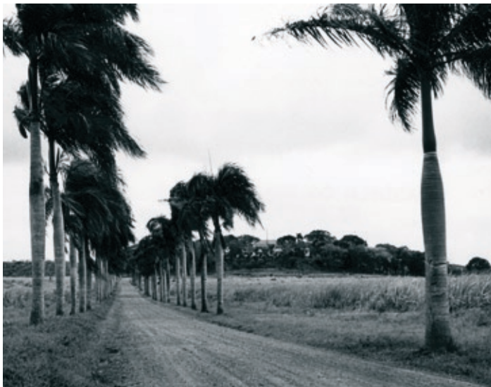
Billede af plantagen Golden Grove set fra Centerline Road.