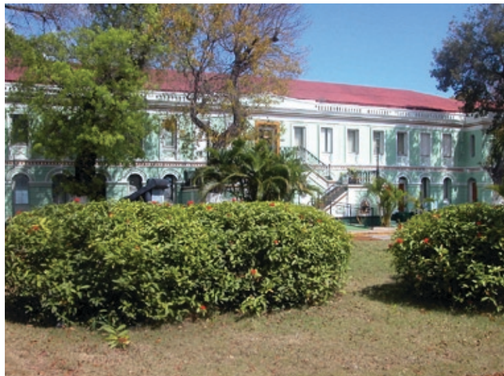
Senatsbygningen i Charlotte Amalie fanget i forfatterens linse en varm marts dag anno 2007.

Et af de spørgsmål, som i sin tid optog Henningsen meget, var danskernes fortid som slaveherrer. Det fremgår, hvis man læser lidt imellem linjerne hos Henningsen, at netop dette tema var et omdrejningspunkt i flere af