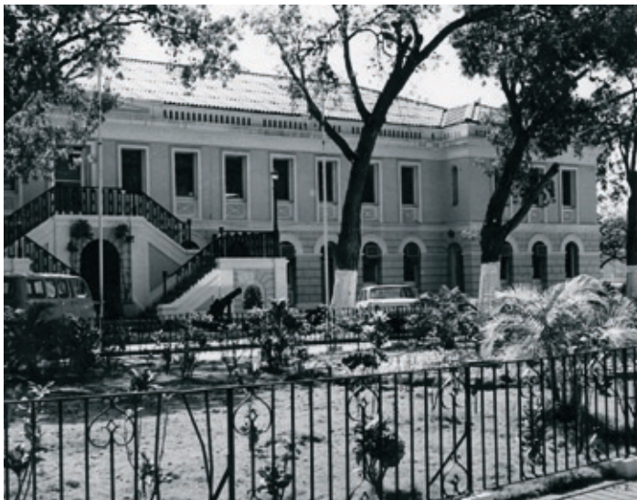
Det danske paradepalads, senatsbygningen i Charlotte Amalie, fanget i Henningsens linse.