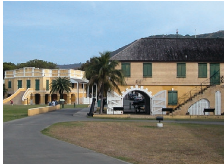
Bygninger på den fredede havneplads i Christiansted. I forgrunden vejrboden.

Anden Verdenskrig øgedes ganske vist den amerikanske interesse for de små caribiske øer langsomt, fortrinsvis i form af investeringer fra private firmaer. Øernes politiske stilling inden for de Forende Stater var imidlertid et tilbagevendende diskussionspunkt og årsag til en udpræget bitterhed hos øernes befolkning. U. S. Virgin Islands var – og er stadigvæk – unincorporated territory , hvilket i realitet betyder, at øerne er styret af den amerikanske regering, og ikke har en fuldt ud ligeværdig repræsentation i Washington. Øernes beboere har heller ikke