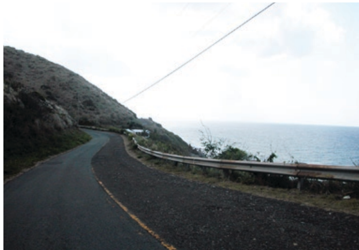
Davies Bay set fra et lidt anden vinkel, end Henningsen gjorde det, men stadig med det karakteristiske forbjerg til Hams Bluff i forgrunden.

stadigvæk i dag efter denne fremgangsmåde. En kortere gæringsproces frembringer en lettere slags rom, kaldet Demerara , som i dag er den mest foretrukne romtype. 4 I de seneste år har Cruzan Rum , i lighed med Barcadi fra Puerto Rico og Goslings fra Bermuda, arbejdet med at genindføre lagret rum. Eksempler på denne romtype er Cruzan Estate Diamond Rum og Cruzan Single Barrel Estate Rum , der lagres på amerikanske egetræsfade i henholdsvis fem og tolv år. De lidt lysere romtyper lagres typisk ikke mere end to år. Ved siden af den lagrede