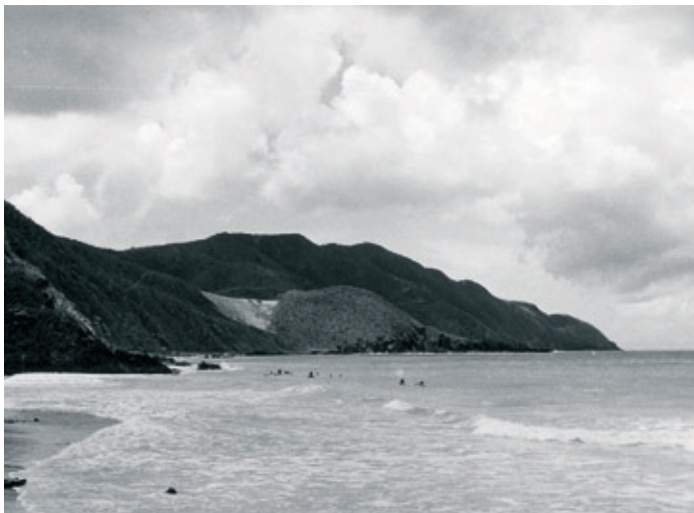
Davies Bay på St. Croix' nordside.