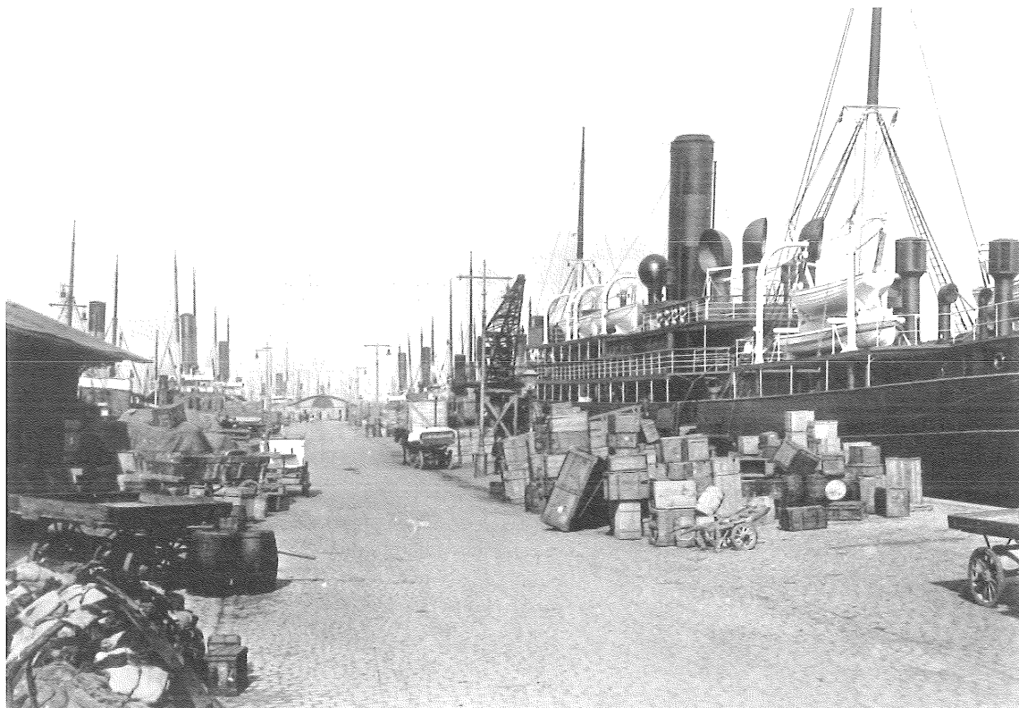
Kvæsthusbroen ca. 1920, med dampskibe langs begge sider. (Foto: H&S).