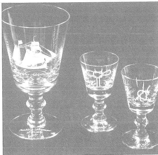
Østersøfarerpokal og snapse-/hedvinsglas med knob 1987