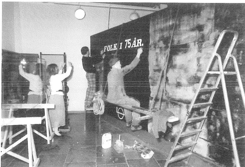
Dagens før dagen, hvor alt var pudset og parat. The day before the big day when everything was polished and ready.