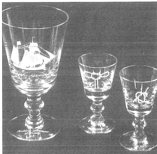
Østersøfarerpokal og snapse-/hedvinsglas med knob 1987