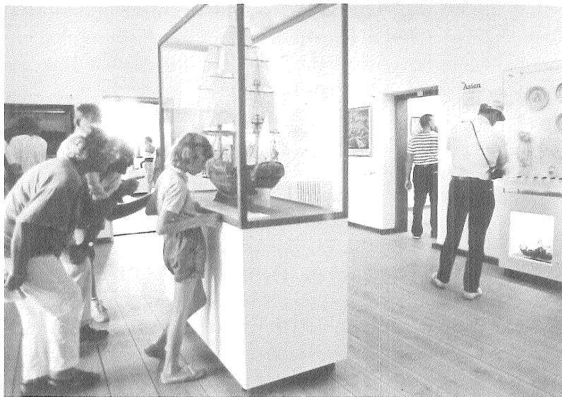
Kinafareren »Disco« og vareprøver fra Østen studeres i museets nye basisudstilling, der også tilgodeser de mindste gæster.

Uden for normal åbningstid blev der afholdt 6 omvisninger.