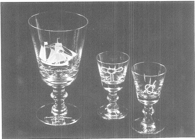
Østersøfarerpokal og snapse-/hedvinsglas med knob 1987

Snapse-/hedvinsglas 1988 med motiv af forskellige knob, 1×2 stk., kr. 213,12