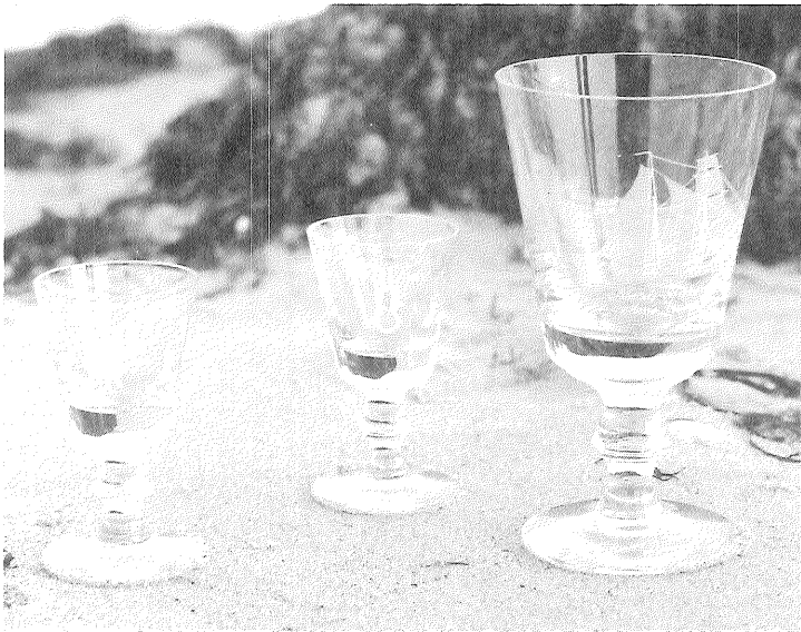
Islandsfarerpokal og snapse-/hedvinsglas med knob 1988

Snapse-/hedvinsglas 1988 med motiv af forskellige knob, 1×2 stk., kr. 213,12