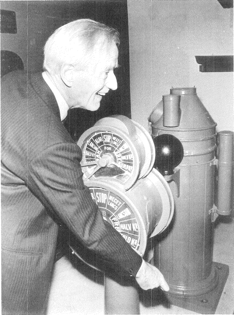
Skibsreder Mærsk McKinney Møller sætter maskintelegrafene fra isbryderen »Storebjørn« på fuld kraft frem og tænder hermed for det elektriske lys i udstillingen. Ship-owner Mærsk McKinney Møller switches the engine-room telegraph of the icebreaker »Storebjørn« (Great Bear) over to full speed ahead and thereby turns on the electric light in the exhibition.