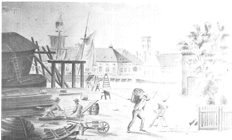
Gammelholm 1858, i baggrunden Holmens kanal og Nikolaj kirke. Så længe der blev bygget skibe af træ, var arbejdsprocesser og redskaber de samme. Farvelagt tegning af J. Hansen, Orlogsmuseet.

As late as 1858 wooden ships were still being built at the naval yards. Here a photograph shows Gammelholm.