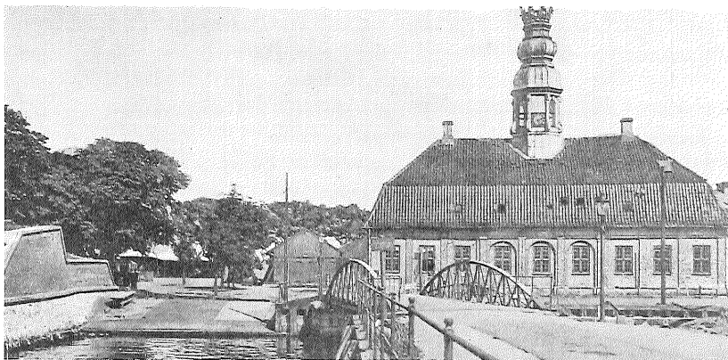
Nyholms vagt. Håndværkerne kom over broen ved bomløbet for at stille til mønstring ved beddingerne ved Nyholms vagt. I tilfælde af dårligt vejr blev et dispensationssignal hejst ved vagten. Gl. postkort.

The guard-house at Nyholm. Workers crossed the bridge to the guard-house where they reported for duty at the slips. When the weather was bad a dispensation signal was flown at the guard-house.