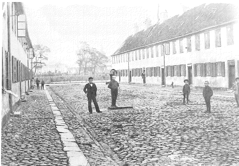
Svanegade i Nyboder med de toetages husrækker, der fra 1760'erne dels udgjorde en udvidelse af Nyboder, dels gradvis erstattede de oprindelige, lave længer. Fot. fra o.1900. Orlogsmuseet.

Svanegade in Nyboder. These rows of two storey houses not only extended the area of Nyboder after 1760 but also gradually replaced the original low dwellings which were built in the 1630's for naval personnel.