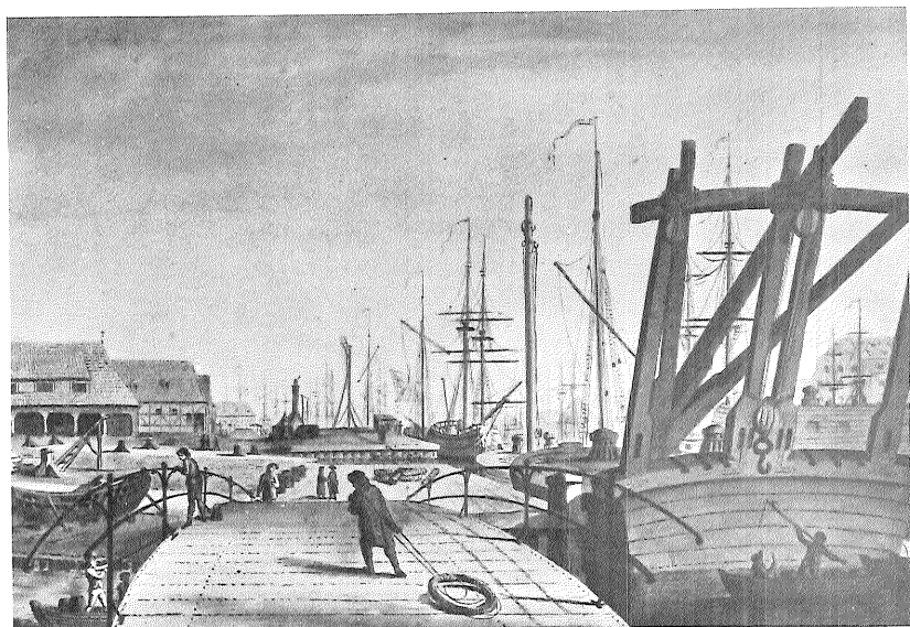
Dagligt liv på flådens gamle værft, Gammelholm, 1787. Til venstre ligger skur til barkasser, i midten er et begkokeri. Farvelagt tegning af Jens Bundsen. Københavns Bymuseum.

Gammelholm in 1787. One of the very rare pictures from the period of an everyday scene at the old naval yard.