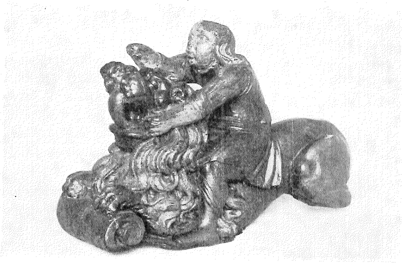
Samson kæmper med løven. Bemalet træskulptur fra den slesvigske søfartso Föhr, ca. 1700. Figuren har siddet som ornament på rorpinden over ror- hovedet på et mindre fartøj, således som det brugtes i Holland. Forbindelserne mellem de vestslesvigske øer og Holland var særdeles livlige; en stor del af de hollandske hvalfangere var bemandede med søfolk herfra. — Gave fra selskabet Handels- og Søfartsmuseets Venner.

Rudder head figure from the island of Föhr, ab. 1700, representing Samson fighting the lion.