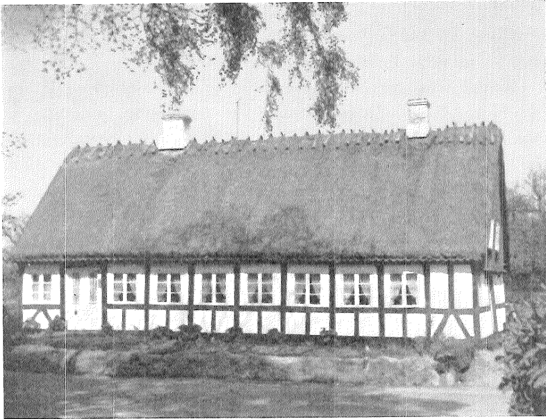
Et andet af de mange pyntelige 1700-tals skipperhuse i Troense, Grønnegade 43.

Another captain's house in Troense, 18th century.