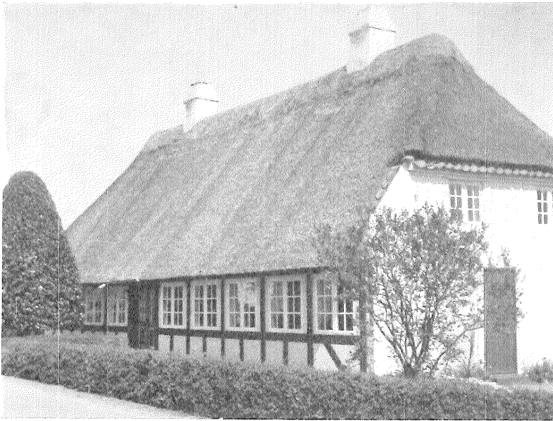
Skipperhus fra 1700'erne, Grønnegade 21, Troense. Huset blev restaureret 1864. Fot. Preben Larsen.

Typical captain's house in Troense, island of Tåsinge, 18th century.