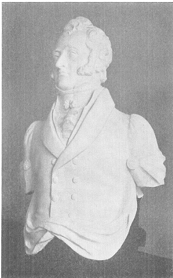
Gallionsfigur fra ukendt skib, af typen „rederen“, en glatbarberet herre med kindskæg og iklædt dragt fra begyndelsen af 1800-tallet, med kalvekrøs, halsbind, „fadermordere“, dobbeltradede frakke og kappe over skulderen. – Handels- og Søfartsmuseet.