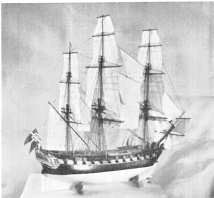
Model af fregatten „Disco“, konstrueret af fabrikmester Henrik Gerner 1777. Udført efter konstruktionstegninger i Rigsarkivet.

type; endelig af en færing af Nordfjordstype. Hertil knytter sig et oversigtskort med indstregninger for de forskellige typers forekomst. Museet anser det for at være af megen værdi i sit arkiv at have opmålingstegninger af disse norske typer.