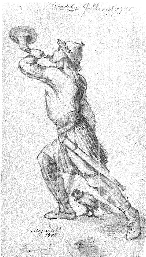
Tegning til gallionsfigur „Heimdal“ (J. Magnus Petersen).

Dampskibsselskabet „Orient“, Dampskibsselskabet „Pacific“, A. E. Sørensen, Svendborg, Dampskibsselskabet „Viking“ samt Det Østasiatiske Kompagni. Endvidere har en kreds af firmaer inden for shipping-branchen støttet museet og dets veneselskab ved at yde bidrag til udgivelsen af museets årbog i form af tilskud eller annoncer.