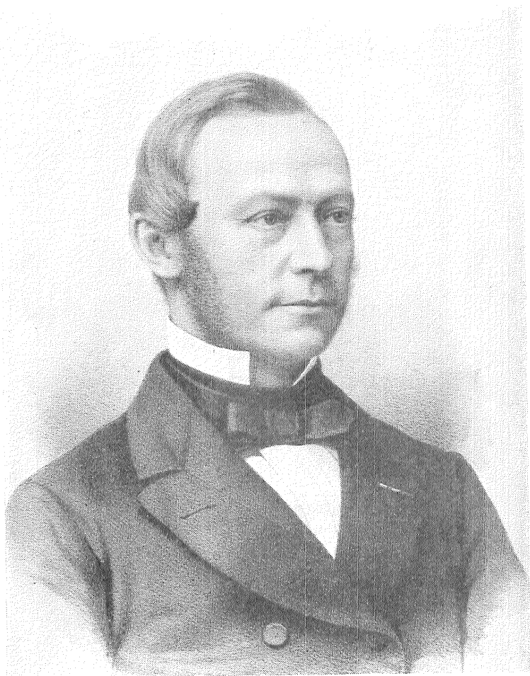
Købmand C. F. Tietgen (1829—1901), som fremhjælp og styrkede Danmarks næringsliv på enhver måde og som så det som sin opgave at skabe respekt og tillid om købstypen, hvad samtiden undervurderede. Gav store summer til kirkeligt arbejde. Litografi af W. Tegner.

købstype, så måtte man vistnok følge den linje, som engang Søren Kierkegaard fremsatte, at et menneske skal og kan holde det ude fra hinanden, holde det åbenbart, som han kalder det, hvor det er, at han arbejder for sin