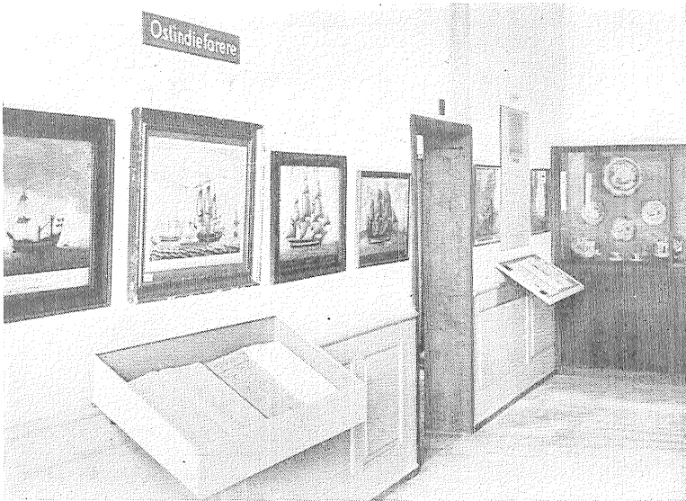
Nyopstillingen. Interiør fra den ostindiske Afdeling.

(Lodsskilte, Lodsflag etc.), Toldvæsenet (Toldkort, Toldflag), Rednings- og Bjergningsvæsenet, Navigationsdirektøren, Grønlands Styrelse (grønlandske Frimærker og Penge fra sidste Verdenskrig), D.S.B., af andre Institutioner nævnes Navigationskolerne, Stiftelsen Georg Stages Minde, Søfartens Bibliotek (en Bogkasse med Bøger), Søfartsklubben, Rederiet J. Lauritzen (Modeller af M/S „Argentinian Reefer“ samt Skoleskibet „Rømø“, Rederiflag), C. K. Hansen (Model af M/S „Dansborg“), Dampskibsselskabet paa Bornholm af 1866 (Model af M/S „Hammershus“), Det Forenede Dampskibs Selskab, Det Østasiatiske Kompagni, Det Danske Petroleums Aktieselskab, Em. Z. Svitser (Søkort samt Kort over Svitseres Operationsfelt gennem Tiderne), Nakskov Skibsværft, Burmeister & Wain, A/S Helsingørs Jernskibs- og Maskinbyggeri, A/S Maskinfabriken „Gentas“ (Logge af forskellig Konstruktion), Iver C. Weilbach & Co., Dansk Radio Aktieselskab. Udover det særligt anførte er i ovennævnte Tilfælde ydet Oplysninger eller Fotografier, evt. begge Dele.