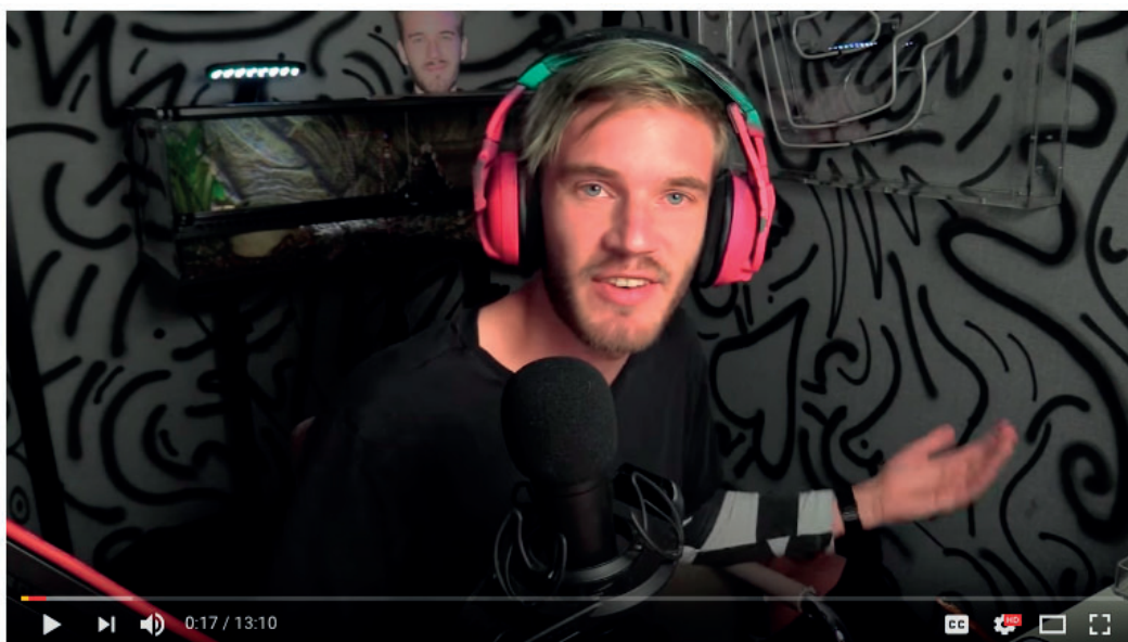
Screenshot fra "MY WORST VIDEO"

hellige sig sin videoproduktion, og han tog arbejde i en pølsevogn for at finansiere sin tilværelse. Allerede i 2012 havde han fået over en million abonnenter, og i løbet af 2013 blev PewDiePie den bruger på YouTube med flest abonnenter. Hans YouTube-kanal har i skrivende stund over 66 mio. abonnenter (PewDiePie, 2018) og over 3600 videoer uploadet siden 2010. De har tilsammen akkumuleret over 18 mia. views (PewDiePie, 2018). PewDiePie indledte sin YouTube-karriere med Let's Play-videoer af forskellige computerspil, men blev først rigtig populær pga. sine Let's Play-videoer af horror games som fx Amnesia (2010) og Silent Hill (2012).