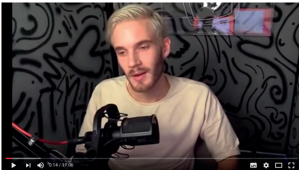
Screenshot fra "My Response"

2017 var et skelsættende år for PewDiePie, der på baggrund af videoer fra februar og september var omdrejningspunktet for to såkaldte shitstorme, der begge stillede spørgsmål ved PewDiePies ideologiske aspirationer. Han blev af The Wall Street Journal (WSJ) anklaget for at vise racistisk indhold i sine videoer. I denne analyse vil jeg udelukkende beskæftige mig med eftervirkninger af videoen fra februar, hovedsageligt PewDiePies egen respons på de negative reaktioner fra medier og samarbejdspartnere. Videoen hedder "My Response" (PewDiePie, 2017) og er ca. elleve minutter lang. Sidenhen har PewDiePie slettet videoen. Han fortæller i en video, postet en uge efter, at "My Response" blev misforstået bl.a. af mainstreammedierne, og at han derfor vil forklare sig i en ny video.