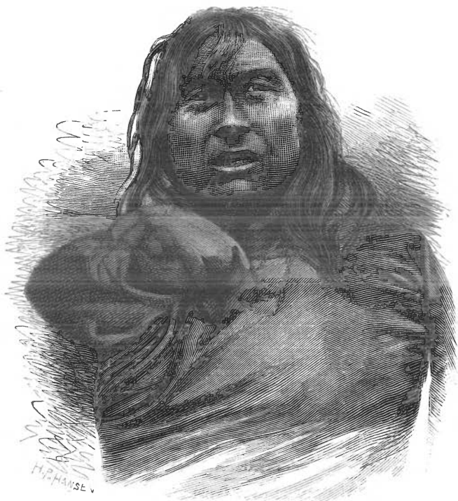
Fig. 7. Augpalugtök.

Alle disse tre Morderere ere unge Mænd, og det synes ikke, som om Nogen har Uvillie imod dem paa Grund af Mordene.