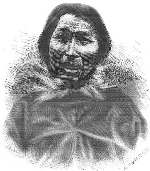
Fig. 1. Milagtek .

thi alle Familier maa samtidig flytte ind for at faa Huset opvarmet. Jeg hørte Milagtek ved en saadan Lejlighed beordre Vinduerne isatte og Lamperne tændte. Samtidig tændtes da et Dusin Lamper, som snart opvarmede Huset, saa at Klæderne kunde aftages.