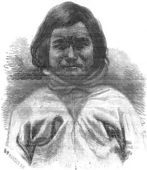
Fig. 4. Ukutiak.

Brixen. Der sad han med nedadvendt, aldeles ubevægeligt og udtryksløst Ansigt og stønnede af og til. Han sagde, at jeg maatte give ham et Huetøj, fordi han, naar han har Anorak'en paa, altid skal have Hovedet bedækket og ikke maa se opad mod Solen, førend han har fanget. Jeg skulde tillige give ham Svovlstikker, fordi han ikke maatte gjøre Ild med Fyrtøjet, førend han var flyttet ind i et nyt Hus; thi han var vant til, at hans