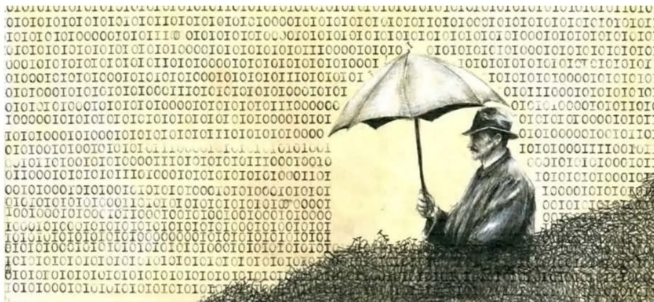
Årets vinderbillede har titlen 'Overload', tegnet af Pieter de Jaeger fra Belgien.