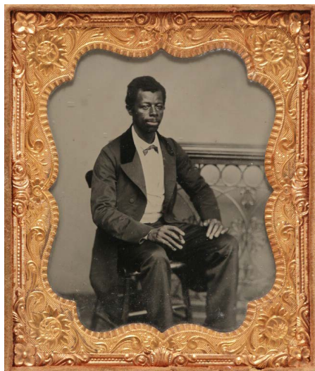
Daguerreotypi fra Levin Jørgen Rohdes samling fra Dansk Vestindien.

Det Nationale Fotomuseum, Det Kgl. Bibliotek har Skandinaviens største samling af daguerreotypier og forsøger altid at erhverve særligt danske eksemplarer, når muligheden opstår.