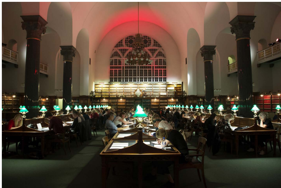
Den gamle læsesal i eftertænksom belysning: brevskrivningskoncerterne var et tilløbsstykke og alle pladser udsolgt.

samling af mere end to millioner breve vidner om, har denne korrespondanceform i århundreder været den vigtigste måde at udtrykke sig på.