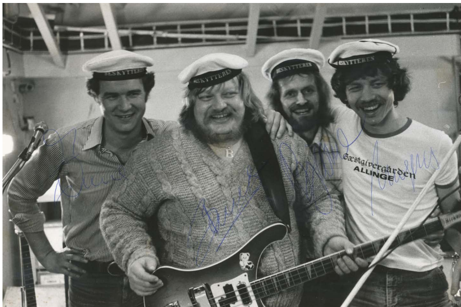
Bamses Venner ombord på inspektionsskibet 'Beskytteren' under et ophold i Tórshavn i 1979.

arkivet også kalendere og notesbøger fra 1940'erne og frem, med såvel professionelle som personlige betragtninger. Arkivet er doneret af Marguerite Vibys datter, skuespillerinden Susse Wold.